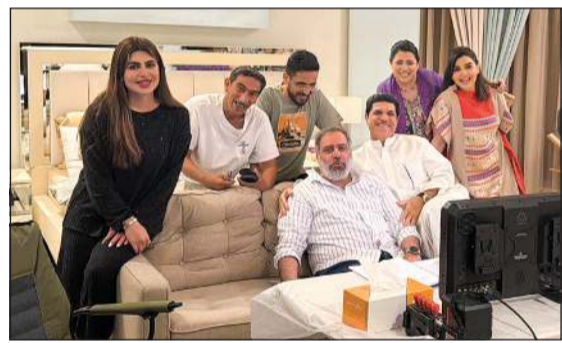
جانب من كواليس مسلسل «كل يوم سألقة»

وأردفت: أنا بطبيعي أحب الكوميديا، والمحيطون بي دائما ينصحونني بالتركيز على هذا الجانب، والحمد لله أشعر أن الجمهور احبني من خلال هذا اللون الفني، خاصة عبر تفاعلهم وتشجيعهم لي في مسرحية «المايسترو» مع النجم الكبير د.طارق العلي، لأفتة إلى أن المسرحية تدور في إطار كوميدي درامي ممزوج بالاستعراضات الغنائية، وتتناول صراعات الطمع والحياة داخل العائلة، حيث تجسد شخصية «سعاد»، وهي فتاة خفيفة العقل وبسطة التفكير تسعى زوجة أخيها إلى تزويجها من أي شخص للاستياء على ميراثها، لتتولى بعدها