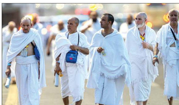
اكتمال وصول الحجاج إلى صعيد عرفات