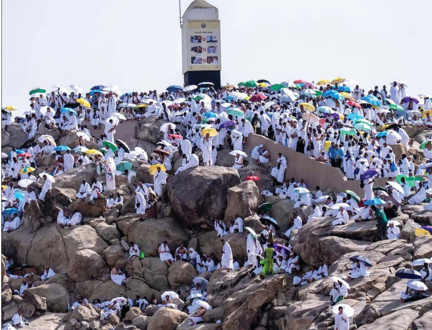
حجاج بيت الله الحرام يتضرعون إلى الله على جبل الرحمة في يوم الوقوف على عرفات (واس)

عواصم - وكالات: في مشهد إيماني مهيب احتشد أكثر من 1,7 مليون حاج وحاجة أمس في التاسع من ذي الحجة لعام 1447هـ، على صعيد عرفات الطاهر، وقد علت وجوههم السكينة والخشوع وارتفعت أكفهم إلى السماء بالدعاء والرجاء في يوم يعد من أعظم الأيام وأكثرها روحانية، حيث امتزجت الدموع بالتكبير وتوحدت القلوب على طلب الرحمة والمغفرة والعطف من النار، ليؤدوا ركن الحج الأعظم، قبل أن ينفروا إلى مزدلفة مع غروب شمسها، وعلى سفوح جبل الرحمة ومحيطه، تجلست صور روحانية مهيبة لحجاج من مختلف الثقافات والجنسيات، جمعهم الرجاء والإخلاص لله تعالى، حيث ارتفعت أكف الضراعة وذرقت دموع الخشوع في مشهد يجسد الأثر العميق للوقوف بعرفة في وجدان المسلمين.