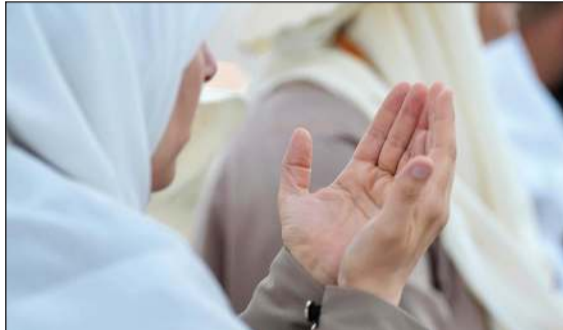
ضيوف الرحمن يرفعون أكف الضراعة