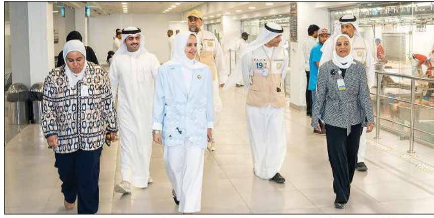
وزيرة الدولة لشؤون التنمية والاستدامة - دريم الفليج خلال جولة تفقدية على عدد من المسالخ

الخدمات للمضحين وفق أعلى مستويات السلامة والتنظيم. وأشادت بالدور الكبير