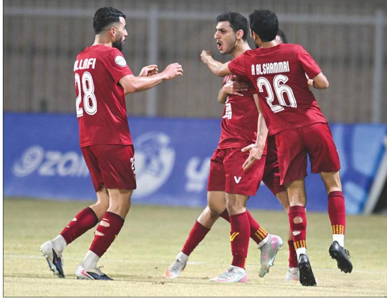
مستوى ثابت وتلق كبير للنصر في الجولات الأخيرة

من الواضح أن العربي يعاني فنيا أكثر مما يعاني بدنيا، فالفوارق بينه وبين منافسيه كبيرة، لكن في أوقات كثيرة تحد الفريق بتشكيلة وتديلات غير موفقة، وهو ما حدث في مواجهة التضامن السابقة وتكرر في مباراة الجهراء، رغم أنه كان في أمس الحاجة لتلك النقاط التي