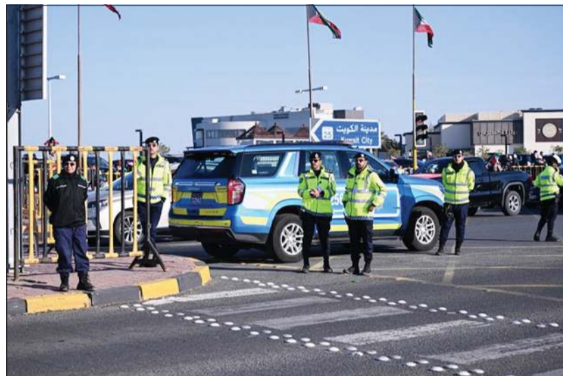
رجال «الداخلية» خلال تأمين الطرق

بناء على تعليمات وتوجيهات النائب الأول لرئيس مجلس الوزراء ووزير الداخلية الشيخ فهد اليوسف وبمناسبة عيد الأضحى المبارك، أصدر وكيل وزارة الداخلية اللواء عبدالوهاب الوهيبي، قراراً بالإفراج عن جميع أعضاء قوة الشرطة الموقوفين انضباطياً والاكتفاء بالمدة التي قضاهوا كل منهم، تأتي هذه اللقطة الكريمة إيماناً منه بأهمية مشاركة أبنائه العسكريين مع أسرهم وأهاليهم فرحة هذه المناسبة المباركة، وتعزيزاً للجوانب الإنسانية والاجتماعية داخل المؤسسة الأمنية.