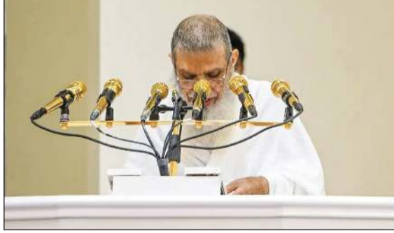
خطيب عرفة د.علي الحذيفي

نائب أمير مكة المكرمة: المملكة كرّست جهودها ليؤدي ضيوف الرحمن مناسكهم في أجواء منظمة وآمنة