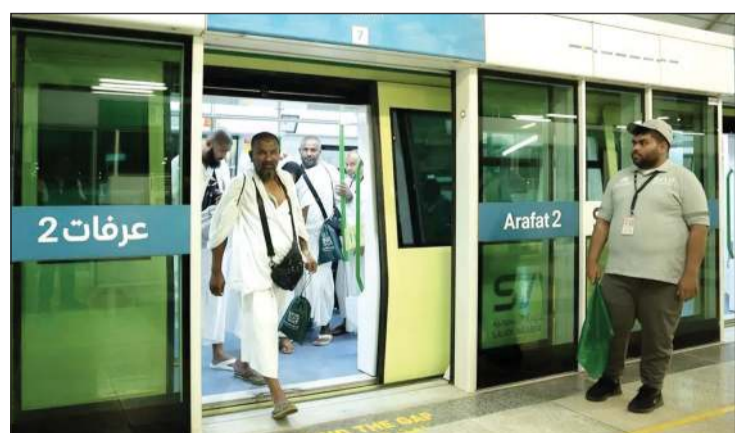
حركة انتقال الحجاج شهدت انسيابية ومرونة

قنصلنا في جدة: توفير أعلى مستوى من الخدمات والراحة للحجاج وضمان انسيابية تنقلهم وأدائهم المناسك بكل سهولة