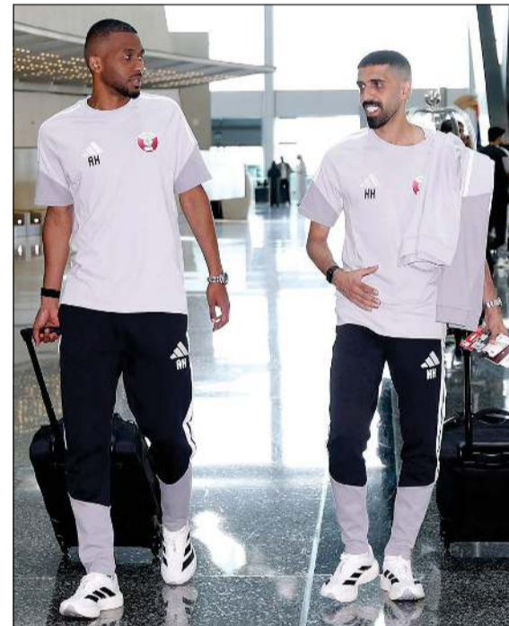
بعثة المنتخب القطري تغادر إلى دبلن

مشاركته سيلعب عمره حينها 42 عاماً و217 يوماً، متجاوزاً الرقم التاريخي الذي سجله الكاميروني روجيه ميلا منذ مونديال 1994 في الولايات المتحدة عندما شارك بـ 42 عاماً و39 يوماً، ولم يكن سوريا المستبعد الوحيد بل شملت 6 لاعبين آخرين هم: طارق سلمان، فهد بونس، بسام الأخرية من التحضيرات، والتي تتضمن معسكراً إعدادياً ومباراة ودية أمام منتخب السلفادور في لوس أنجلوس يوم 6 يونيو المقبل.