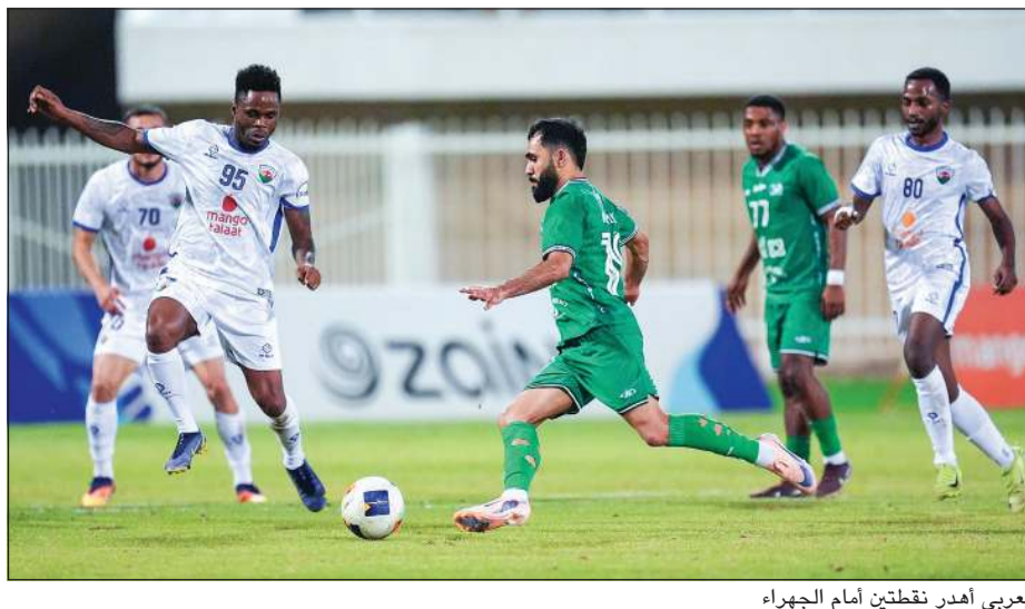
العربي أهدر نقطتين أمام الجهراء

الحافز يقل لدى لاعبينا، وهنا يكمن دورنا الحقيقي كمجلس إدارة وجهازين فني وإداري في