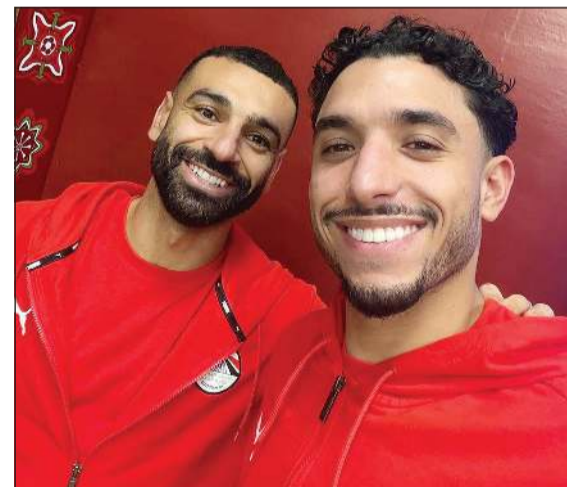
انضمام محمد صلاح وعمر مرموش لمعسكر المنتخب المصري

بطولة دوري أبطال أفريقيا الموسم المقبل، وكشف النادي في بيانه أن سداد المستحقات تم عبر العوائد المالية الخاصة بالتطبيق الرسمي للنادي «زملكوي»، في محاولة للاستفادة من الموارد الاستثمارية الجديدة لتخفيف الأعباء المالية المتركمة. ورغم هذه الخطوة، لا تزال أزمة إيقاف القيد تمثل تحدياً كبيراً أمام إدارة الزمالك، في ظل وجود 16 قضية أخرى ضد النادي، تصل إجمالي الغرامات فيها إلى نحو 6 ملايين دولار، وتسعى إدارة النادي إلى غلق أكبر عدد ممكن من الملفات خلال الفترة المقبلة، سواء عبر التسويات المباشرة أو جدولة المستحقات، من أجل رفع عقوبة إيقاف القيد بشكل كامل وتدعيم صفوف الفريق بعناصر جديدة قبل انطلاق الموسم المقبل.