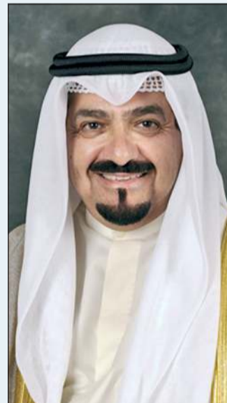
رئيس الوزراء سمو الشيخ أحمد العبدالله

سموه نقل في اتصال مع رئيس البعثة تحيات صاحب السمو وسمو ولي العهد وتمنياتهما للحجاج بالتوفيق واليسر في أداء مناسكهم