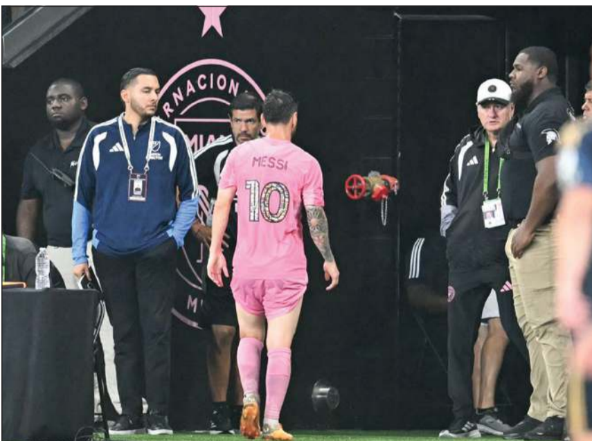
النجم ليونيل ميسي لحظة مغادرته مباراة فريقه إنتر ميامي مع فيلادلفيا

بعد خضوعه لفحوص طبية إضافية، أشار التشخيص الأولي إلى وجود إجهاد زائد مرتبط بإرهاق عضلي على مستوى العضلة الخلفية للعضلة اليسرى.