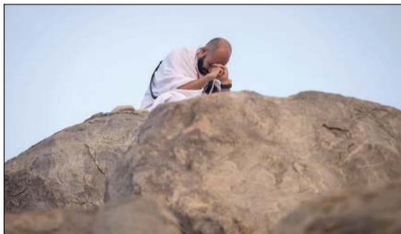
أحد الحجاج يتضرع إلى الله على جبل الرحمة (واس)