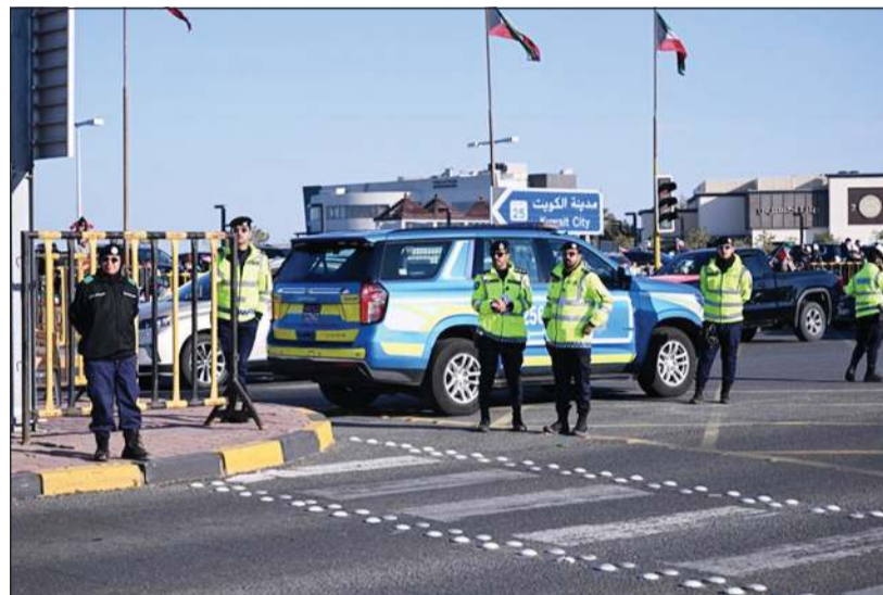
رجال «الداخلية» خلال تأمين الطرق

بناء على تعليمات وتوجيهات النائب الأول لرئيس مجلس الوزراء ووزير الداخلية الشيخ فهد اليوسف وبمناسبة عيد الأضحى المبارك، أصدر وكيل وزارة الداخلية اللواء عبدالوهاب الوهيبي، قراراً بالإفراج عن جميع أعضاء قوة الشرطة الموقوفين انضباطياً والاكتفاء بالمدة التي قضاهوا كل منهم، تأتي هذه اللقطة الكريمة إيماناً منه بأهمية مشاركة أبنائه العسكريين مع أسرهم وأهاليهم فرحة هذه المناسبة المباركة، وتعزيزاً للجوانب الإنسانية والاجتماعية داخل المؤسسة الأمنية.