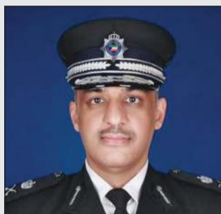
وكيل وزارة الداخلية اللواء عبدالوهاب الوهيبي

بناء على تعليمات وتوجيهات النائب الأول لرئيس مجلس الوزراء ووزير الداخلية الشيخ فهد اليوسف وبمناسبة عيد الأضحى المبارك، أصدر وكيل وزارة الداخلية اللواء عبدالوهاب الوهيبي، قراراً بالإفراج عن جميع أعضاء قوة الشرطة الموقوفين انضباطياً والاكتفاء بالمدة التي قضاهوا كل منهم، تأتي هذه اللقطة الكريمة إيماناً منه بأهمية مشاركة أبنائه العسكريين مع أسرهم وأهاليهم فرحة هذه المناسبة المباركة، وتعزيزاً للجوانب الإنسانية والاجتماعية داخل المؤسسة الأمنية.