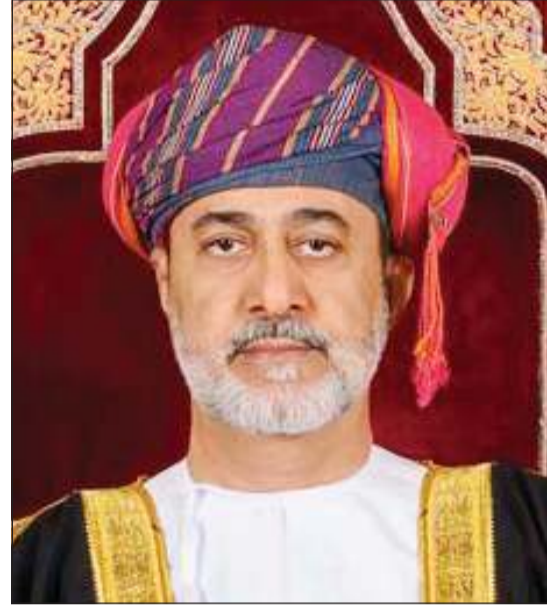
السلطان هيثم بن طارق سلطان عمان