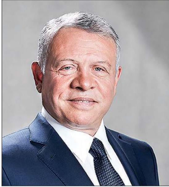
الملك عبدالله الثاني ملك المملكة الأردنية الهاشمية

صاحب السمو هنأ ملك الأردن بعيد الاستقلال: نعتز بالعلاقات الأخوية ونتطلع لتعزيزها وتطويرها لما فيه خير ومصالحه البلدين