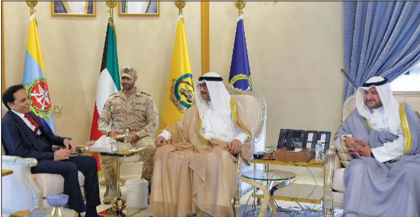
وزير الدفاع ووزير الداخلية بالإدارة الشيخ عبدالله العلي خلال اللقاء مع سفير باكستان د.ظفر إقبال بحضور وكيل وزارة الدفاع الشيخ د. عبدالله المشعل

كونا: بحث وزير الدفاع ووزير الداخلية بالإدارة الشيخ عبدالله العلي مع سفير جمهورية باكستان الإسلامية لدى الكويت د.ظفر إقبال سبل دعم وتطوير التعاون الثنائي في مختلف المجالات بما يعكس عمق العلاقات الوثيقة التي تربط البلدين الصديقين. وقالت وزارة الدفاع في بيان صحافي إنه تم خلال اللقاء استعراض عدد من الموضوعات والقضايا ذات الاهتمام المشترك.