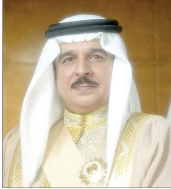
ملك البحرين الملك حمد بن عيسى