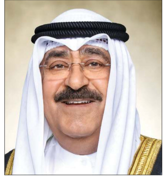
صاحب السمو الأمير الشيخ مشعل الأحمد

لبلاده، معربا سموه عن بالغ اعتزازه بالعلاقات الأخوية التاريخية التي تربط بين دولة الكويت والمملكة الأردنية الهاشمية الشقيقة، مؤكداً التطلع الدائم والمشارك لتعريفها وتطويرها لما فيه خير ومصالحه البلدين الشقيقين، متمنيا سموه له دوام الصحة والعافية وللمملكة الأردنية الهاشمية الشقيقة وشعبها الكريم المزيد من التقدم والازدهار في ظل القيادة الحكيمة له.