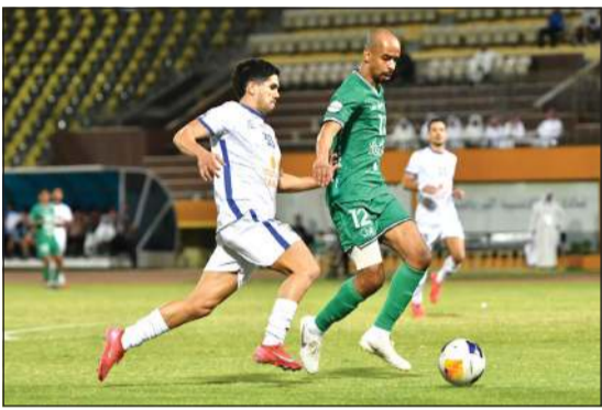
العربي يسعى لتجاوز الجهراء للمنافسة على «الوصافة»