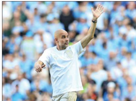
مدرب مان سيتي بييب غوارديولا يودع الجماهير

تختتم مباريات الجولة الـ 16 لدوري زين الممتاز اليوم بإقامة مباراتين، تجمع الأولى الجهراء بـ 7 نقاط مع العربي بـ 25 نقطة على ملعب الأول مبارك العيار، فيما يلتقي في المباراة الثانية التضامن برصيد 12 نقطة مع القادسية بـ 25 نقطة على ملعب نايف الدبوس بنادي الفحيحيل. بعدما جاء في المرتبة الأخيرة، حيث لم يحقق سوى فوز واحد وخسر 12 مباراة وبات وضعه صعبا في البقاء في الدرجة الممتازة بعد أن مر بحالة متقلبة خلال الجولات الماضية، أما العربي فيسعى إلى تجميع النقاط للدخول مطمئنا بمجموعة البطولة بعدما تعثر في المباراة الماضية مع التضامن 1-1، ويهيم لاعبي «الأخضر» المنافسة على الوصافة بعدما بات من الصعبه اللحاق بالكويت المتصدر.