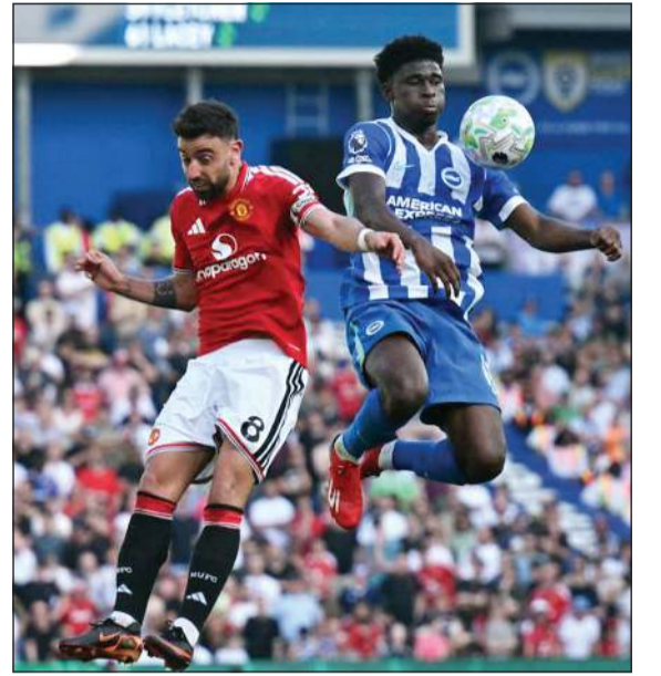
نجم مان يونايتد برونو فرنانديز يحاول إيقاف لاعب برايتون كارلوس باليا