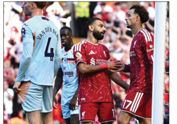
نجم ليفربول محمد صلاح يهني كورتس جونز بالهدف