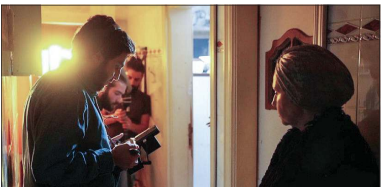
مشهد من المسلسل

والفقر، من خلال أحداث تتميز ببينة سردية مكثفة واقتصاد في عدد الشخصيات والأماكن، ما منحها طابعاً بصرياً وإنسانياً قريبا من اللغة السينمائية، مع تركيز على التفاصيل اليومية التي عاشها السوريون، من انقطاع الكهرباء وشح الوقود إلى الحواجز والاعتقال والاعتراق.