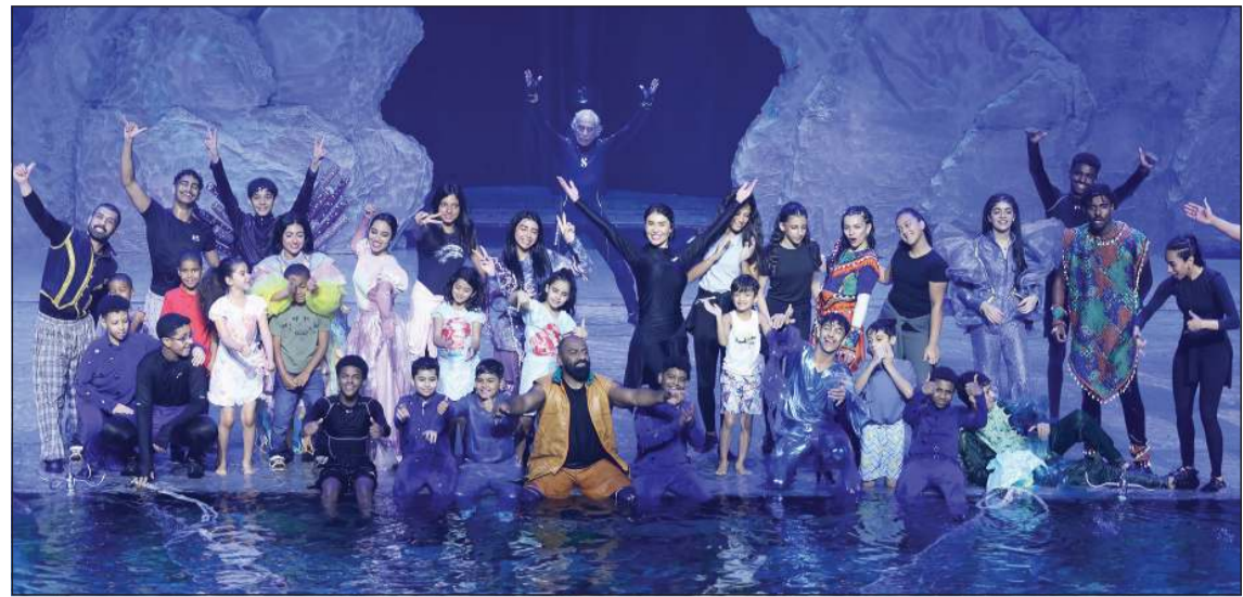
لقطة جماعية لبعض نجوم المسرحية