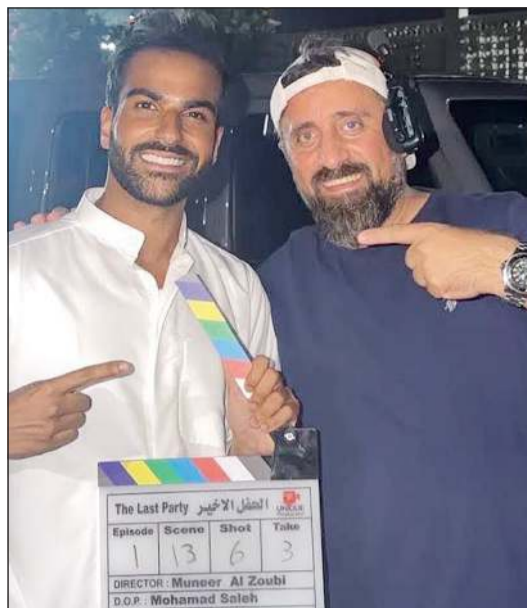
مدير الزعبي في لوكيشن التصوير

الزعبي بأنه سبق وان دعم العديد من الأسماء الشابة في تجاربه الإنتاجية اليومية وهالشى مبدأ يقوم به عدد كبير من المخرجين والفنانين لدعم المنتجين الشباب، وهالشى دعني للمشاركة في هذا المسلسل الذي ينتجه الفنان فيصل فريد من خلال شركة F.Unoq.