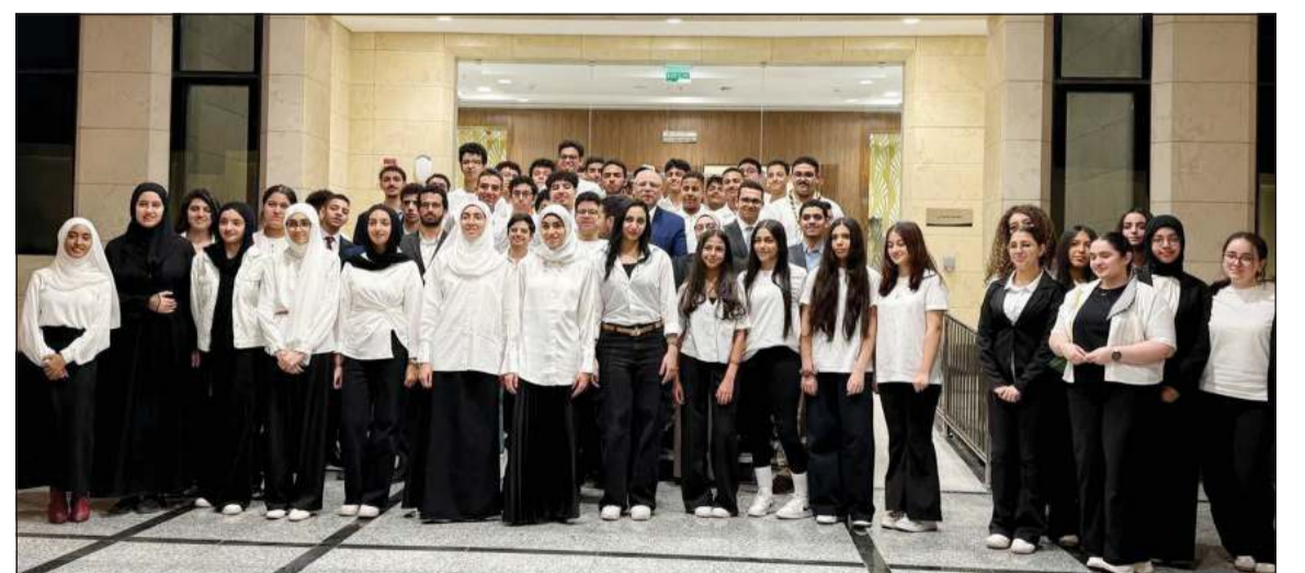
السفير المصري لدى البلاد محمد أبو الوفا مع عدد من الطلاب

بالسفارة، ان الدولة المصرية بمختلف مؤسساتها تضع ثقة كبيرة في شبابها وطلابها داخل وطن وخارجه، وتعمل عليهم في تحقيق أهداف التنمية المستدامة وصياغة مستقبل أكثر إشراقاً. كما استعرض عدداً من المبادرات والبرامج التي أطلقتها الدولة بهدف تنمية قدرات