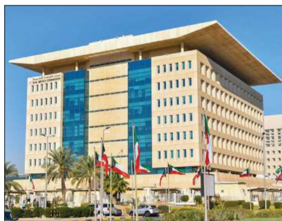
تقبل الإعفاءات المعتمدة ومستمرة خلال هذا الأسبوع المبارك، آجابت المصادر: نعم ومتاح أياً والأنظمة مازالت

بعد ان كان الديوان قد حددتها من 1 حتى 15 الجاري. ومن الأهمية ذكر أن الديوان أجاز للجهات الحكومية تطبيق نظام تدوير الموظفين أسبوعياً أو يومياً أو إلزام البعض بالعمل طوال أيام الأسبوع بدون تدوير أو العمل مع بعد، مع احتساب الفترة التي يعفى الموظف من العمل خلالها تعتبر مدة مزاوله فعليه. وصدر التعميم بذلك في 2 مارس واستمر العمل به حتى 30 أبريل، وصدر تعميم بعودة العمل بنسبة 100٪ اعتباراً من 3 الجاري.