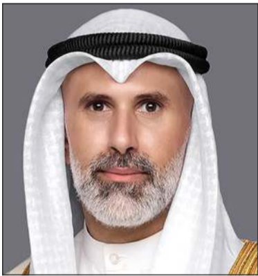
وزير الخارجية الشيخ جراح الجابر

أجرى وزير الخارجية الشيخ جراح جابر الأحمد اتصالاً هاتفياً مع نائب رئيس الوزراء ووزير الخارجية وشؤون المغتربين في المملكة الأردنية الهاشمية الشقيقة أيمن الصفدي، حيث تم خلال الاتصال مناقشة تطورات الأحداث الراهنة في المنطقة والجهود المبذولة بشأنها، وسبل تعزيز الأمن والاستقرار الإقليمي والدولي.