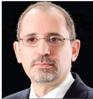
نائب رئيس الوزراء وزير الخارجية الأردني أيمن الصفدي