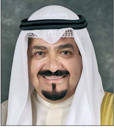
سمو الشيخ أحمد عبدالله رئيس مجلس الوزراء

كونا: بعث سمو الشيخ أحمد عبدالله رئيس مجلس الوزراء ببرقية تهنئة إلى د. رشاد محمد العلمي رئيس مجلس القيادة الرئاسي في الجمهورية اليمنية الشقيقة بمناسبة ذكرى العيد الوطني لبلادها.