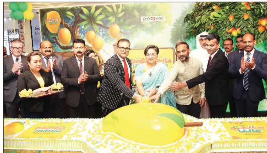
سفيرة الهند بارميثا تريباتي خلال قطع كيكة الاحتفال

إلى جانب أركان تصوير مميزة وأنشطة عائلية ممتعة تعزز تجربة التسوق وتجعلها أكثر تفاعلا ومتعة لجميع أفراد الأسرة. كما نظم فرع لولو الري ضمن احتفالات الافتتاح فعاليات تفاعلية للأطفال، من أبرزها مسابقة تزيين كعكة المانجو، التي أضفت أجواء مليئة بالحيوية والمرح العائلي.