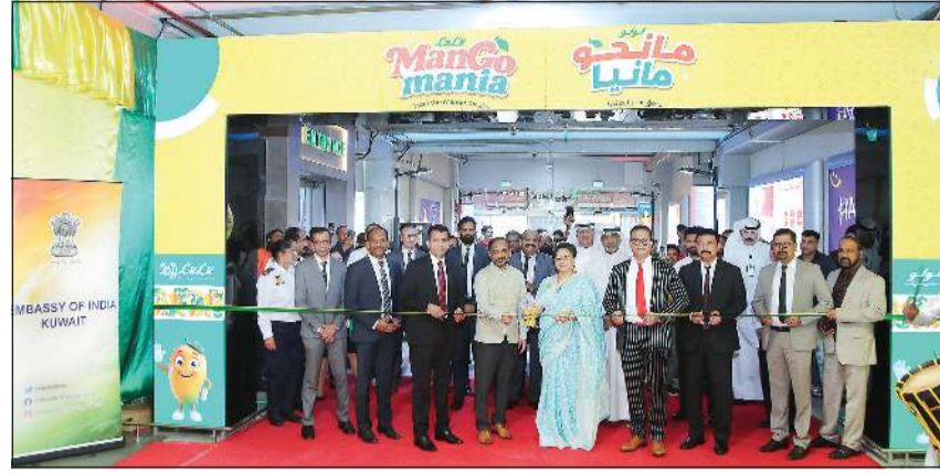
سفيرة جمهورية الهند بارميثا تريباتي خلال قص شريط الافتتاح