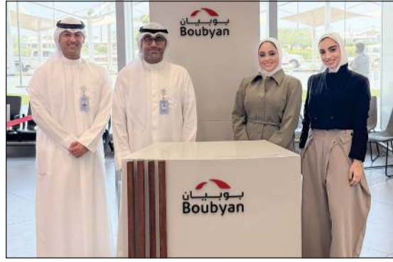
فريق إدارة الاتصالات والعلاقات المؤسسية أثناء توزيع الحجاج وتقديم الهدايا لهم

وأضاف «نؤمن في بنك بوبيان بأن دورنا يتجاوز تقديم الخدمات المصرفية، لتشمل التواجد الفعلي في المناسبات التي تمس المجتمع، وهو ما نحرص على ترجمته من خلال مبادرات ميدانية بشارك فيها موظفونا الذين جسدوا اليوم روح الفريق والالتزام بقيم البنك من خلال تفاعلهم المباشر مع الحجاج وتقديم الدعم المعنوي لهم».