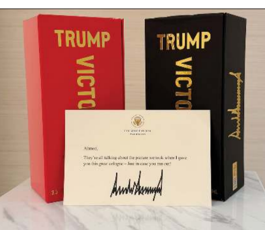
صورة نشرها الرئيس السوري أحمد الشرع للعطر الذي تلقاه من نظيره الأمريكي دونالد ترامب

الشيباني بعضا من العطر. وقال ترامب للشرع إن إحدى العبوتين هدية لزوجه، قبل أن يمازحها بسؤال «كم زوجة لديك؟!». ويذكر الموقع الإلكتروني المخصص لبيع العطر، الذي تبلغ قيمة القارورة منه 249 دولارا، أنه «يجسد القوة والسلطة والانتصار». ومنذ وصوله إلى السلطة، سعى الشرع، رغم ماضيه الجهادي كزعيم لهيئة تحرير الشام، لإعادة ترميم العلاقة مع الولايات المتحدة بعد سنوات طويلة من القطيعة مع الحكم السابق. واتخذ ترامب خطوات كثيرة إزاء السلطات الجديدة على رأسها رفع العقوبات التي كانت فرضت على البلاد خلال حكم الأسد، والتقى ترامب الشرع للمرة الأولى في السعودية خلال زيارة إلى دول الخليج في مايو، وحينها وصف ترامب نظيره السوري بأنه «شاب وجذاب».