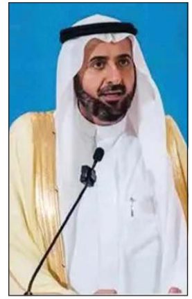
وزير الحج السعودي توفيق الربيعية متحدثا أمام النسخة الخمسين من ندوة الحج الكبرى

والصلاة 15 دقيقة، وذلك مراعاة لظروف الحشود، والتخفيف على الحجاج خلال أوقات الذروة. يأتي ذلك، فيما يواصل ضيوف الرحمن توافدهم بكثافة إلى المسجد الحرام والمسجد النبوي وسط أجواء يسودها الهدوء والسكينة، بينما تتناغم حركة الحشود بانسيابية لافتة تعكس حجم الجهود التنظيمية والخدمية التي سخرتها المملكة لخدمة الحجاج وتمكينهم من أداء مناسكهم بكل يسر وراحة. أعلنت رئاسة الشؤون الدينية بالمسجد الحرام والمسجد النبوي ترجمة خطبة يوم عرفة لعام 1447هـ إلى 35 لغة عالمية، وبها عبر المنصات الرقمية والقنوات التابعة للرئاسة بهدف إيصال رسالة الإسلام الوسطية ومضامين الخطبة الشرعية إلى المسلم في مختلف أنحاء العالم. وأكد رئيس الشؤون الدينية للحرمين الشريفين د.عبدالرحمن السديس أن ترجمة خطبة عرفة تمثل امتدادا لجهود المملكة في خدمة الإسلام والمسلمين، والعناية بضيوف الرحمن. وفي السياق، تواصل الهيئة العامة للعناية بشؤون المسجد الحرام والمسجد النبوي تعزيز منظوماتها التشغيلية والتقنية، حيث يشهد المسجد الحرام تشغيل إحدى أكبر منظومات التبريد في العالم، بطاقة إجمالية تصل إلى 155 ألف طن تبريد، موزعة بين محطتي التبريد (120 ألف طن)، وأجباد (35 ألف طن)، إذ تعتمد هذه المنظومة على تبريد المياه