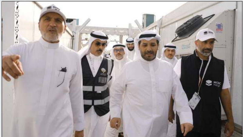
سفيرنا لدى المملكة العربية السعودية الشيخ صباح ناصر الصباح خلال الجولة التفقدية على بعثة الحج الكويتية

أكد تضافر الجهود وتكامل العمل بين الجهات المشاركة لخدمة الحجاج سفيرنا لدى السعودية يطلع على استعدادات بعثة الحج في مكة المكرمة والمشاعر المقدسة