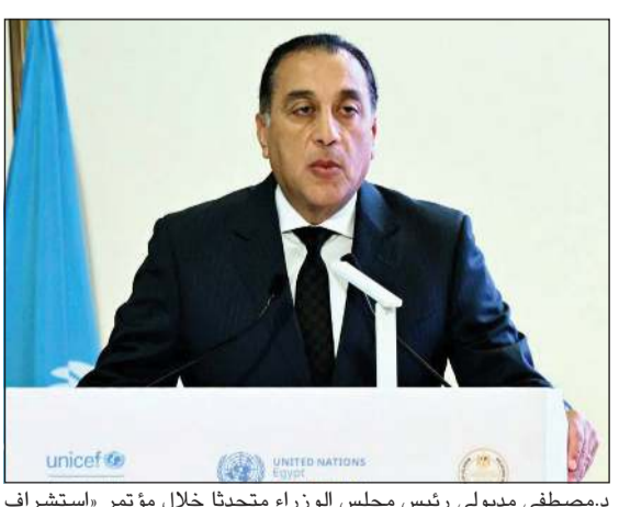
د.مصطفى مدبولي رئيس مجلس الوزراء متحدثا خلال مؤتمر «استشراف مستقبل التعليم في مصر»

القاهرة - هالة عمران قال د.مصطفى مدبولي رئيس مجلس الوزراء إن الدولة المصرية تنظر إلى التعليم باعتباره قضية أمن قومي، ومحورا رئيسيا في مشروع بناء الجمهورية الجديدة، انطلاقا من اقتناع راسخ بأن الاستثمار الحقيقي يبدأ ببناء الإنسان وتنمية قدراته العلمية والفكرية والثقافية، باعتباره الثروة الأكثر استدامة وتأثيرا في مستقبل الوطن. جاء ذلك خلال كلمة ألقاها رئيس مجلس الوزراء أمس ضمن مشاركته في فعاليات مؤتمر «استشراف مستقبل التعليم في مصر» و«عرض نتائج دراسة إصلاح التعليم في مصر.. الأدلة والتقدم والرؤية المستقبلية»، الذي نظّمته وزارة التربية والتعليم والبحث العلمي في العاصمة الجديدة بالتعاون مع منظمة الأمم المتحدة