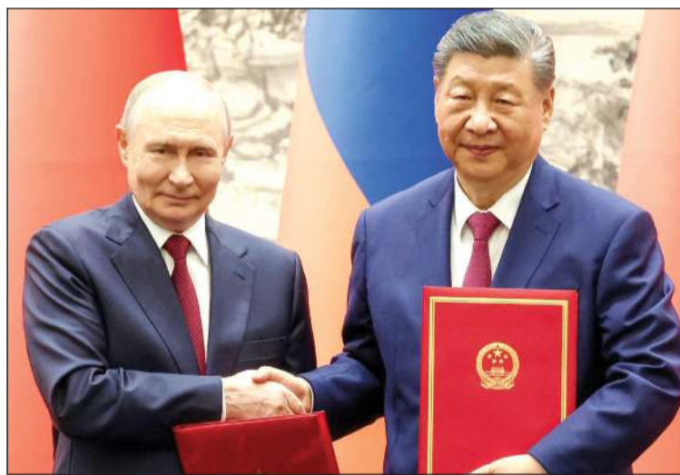
الرئيس الروسي فلاديمير بوتين ونظيره الصيني شي جينينغ يتصافحان خلال مراسم توقيع وثائق التعاون المشترك

الخارجية الصين وروسيا تقريرين بشأن التنسيق والتعاون بين البلدين في الشؤون الدولية والإقليمية. عقب المحادثات، وقع شي وبوتين وأصدرا بيانا مشتركا بشأن تعزيز التنسيق الاستراتيجي الشامل بين البلدين بدرجة أكبر وتعميق علاقات حسن الجوار والتعاون الودي بينهما. وشهد الرئيسان توقيع 20 وثيقة تعاون في مجالات تشمل الاقتصاد والتجارة والتعليم والعلوم والتكنولوجيا. واستقبل جينينغ الرئيس الروسي بابتسامة ومصافحة حارة عند أسفل درج قصر الشعب، مركز السلطة في العاصمة بكين. واستمع رئيسا الدولتين العظميين إلى النشيدين الوطنيين لبلديهما، واستعرضا حرس الشرف، فيما كان عدد من الأطفال يقفزون امامهما بحماسة وهم يهتفون «أهلا سهلا، أهلا وسهلا»، رافعين العلمين الروسي والصيني. وفي مشهدية مطابقة إلى حد بعيد لتلك التي رافقت وصول ترامب إلى بكين، استقبل الضيف الروسي بطاقت الترحيب المدفعية التقليدية. وبعد هذه المراسم الاحتفالية، شكلت زيارة ترامب أحد المواضيع المطروحة على طاولة المحادثات بين شي وبوتين اللذين درج أحدهما على أن يصف