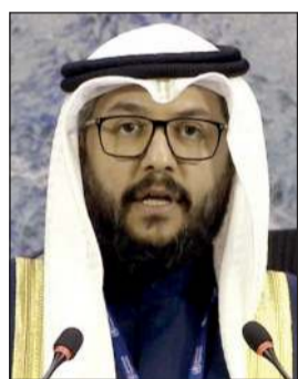
الشيخ د. سلمان الصباح

والبنية التحتية الأساسية. كما شدد على أهمية أن تكون عملية تطوير مستقبل بنىة الصحة العالمية شاملة وشفافة، وأن تفضي إلى مقترحات عملية قابلة للتنفيذ وذات أثر ملموس بما يعزز قدرة المنظومة الصحية العالمية على الاستجابة للتحديات الصحية ومسؤولية اجتماعية لا تقع على عاتق القطاع الصحي وحده، مؤكداً أن استهداف أو تعطيل البنية التحتية المدنية يؤثر بشكل مباشر على الخدمات الصحية والمرضى والمجتمع المحلي. كما استعرض ما شهدته المنطقة خلال الأشهر الماضية من توترات واعتداءات أثرت على عدد من الدول وألقت بظلالها على البنية التحتية الصحية ومسارات الإمداد الإقليمية، الأمر الذي فرض تحديات إضافية على استمرارية الخدمات الصحية والإمدادات الطبية. وأكد في هذا السياق أن النظام الصحي في دولة الكويت أظهر قدرة عالية على الصمود والاستجابة، حيث استمرت الخدمات الصحية الأساسية دون انقطاع بفضل الجاهزية الفعالة والتخطيط الدقيق وتفاني العاملين في القطاع الصحي. واختتم الشيخ د. سلمان الصباح ببيان الكويت بالتأكيد على التزام الدولة بمواصلة العمل البناء مع الدول الأعضاء والأمانة العامة لمنظمة الصحة العالمية من أجل حماية الصحة وتعزيز التعاون الدولي في مواجهة التحديات الصحية العالمية.