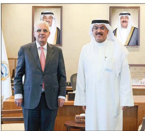
وزير التربية م. سيد جلال الطبطبائي مستقبلاً سفير فلسطين لدى البلاد رامي طهوب

التنظيمي الجديد، بما يحقق الاستفادة المثلى من الكوادر البشرية، ويراعي الاختصاصات والاحتياجات الفعلية للقطاعات والإدارات المختلفة، بما يسهم في تعزيز كفاءة الأداء وتطوير بيئة العمل.