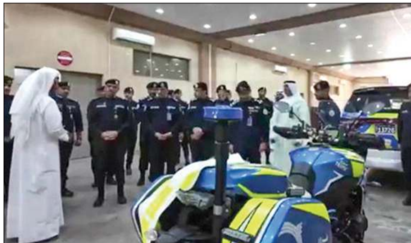
قطاع الشؤون المالية والخدمات المساندة يحرص على الاستعانة بأحدث الآليات والمعدات