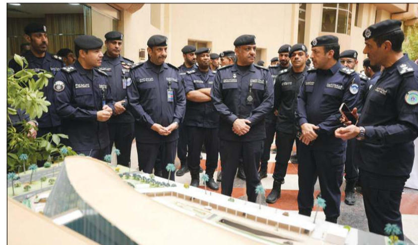
وكيل وزارة الداخلية يطلع على نموذج لهوية بصرية للمباني في وزارة الداخلية

أكد وكيل وزارة الداخلية اللواء عبدالوهاب الوهيب أن قطاع شؤون المالية والخدمات المساندة يعد الركيزة الأساسية للدعم اللوجستي لجميع قطاعات الوزارة، مشيراً إلى أهمية تطوير منظومة العمل بما يسهم في تعزيز كفاءة الأجهزة الأمنية ورفع مستوى جاهزيتها، وشدد على ضرورة الاستمرار في تحديث آليات العمل والاستفادة من