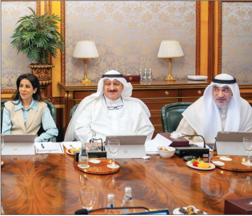
النائب الأول لرئيس مجلس الوزراء ووزير الداخلية الشيخ فهد اليوسف ود. أحمد العوضي ود. نورة المشعان