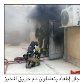
رجال إطفاء يتعاملون مع حريق المخبز

سيطرت فرق إطفاء مركزي حولي والسالمية على حريق سرداب في عمارة بمنطقة حولي يستخدم كمخزن وعمل الحلويات. وقالت قوة الإطفاء العام إن الفرق باشرت مكافحة الحريق والسيطرة عليه، ولم يسفر الحادث عن أي إصابات تذكر.