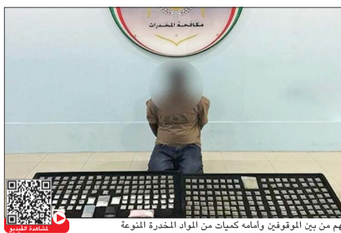
متهم من بين الموقوفين وأمامه كميات من المواد المخدرة المنوعة

أعلنت وزارة الداخلية عن تمكن قطاع الأمن الجنائي، ممثلاً في الإدارة العامة للمخدرات، من ضبط 11 متهماً في قضايا مختلفة عنر بحوزتهم على كميات من المواد المخدرة، ومن بينها الشبو والحشيش والكوكايين، إلى جانب كمية من الحبوب المخدرة وخمور وحصيلة بيع سلاح ناري. وذكرت وزارة الداخلية في بيان لها أن المتهمين هم: مواطنان، وأحد من الجنسية المصرية، وأحدان من الجنسية البنغلاديشية وشخص من الجنسية الهندية، وأحدان من الجنسية النيبالية، و3 أشخاص من المقيمين بصورة غير قانونية. وأضافت الوزارة أن المضبوطات