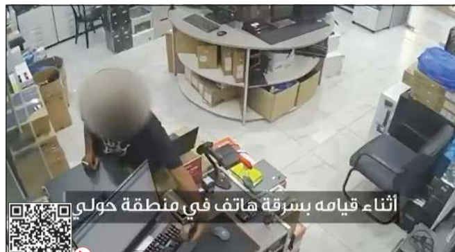
أثناء قيامه بسرقة هاتف في منطقة حولي

كاميرا مراقبة محل هواتف في حولي وثقت قيام أحد المتهمين بسرقة