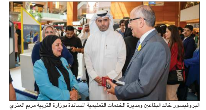
البروفيسور خالد البقاعين ومديرة الخدمات التعليمية المساندة بوزارة التربية مريم العنزي