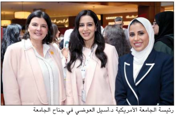
رئيسة الجامعة الأمريكية د.أسيل العوضي في جناح الجامعة

يعد معرض دراستي من أبرز الفعاليات التعليمية في الكويت، إذ يجتمع تحت سقف واحد نخبة من الجامعات والمؤسسات