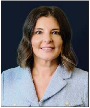
رئيسة الجامعة الأمريكية في الكويت د.أسيل العوضي