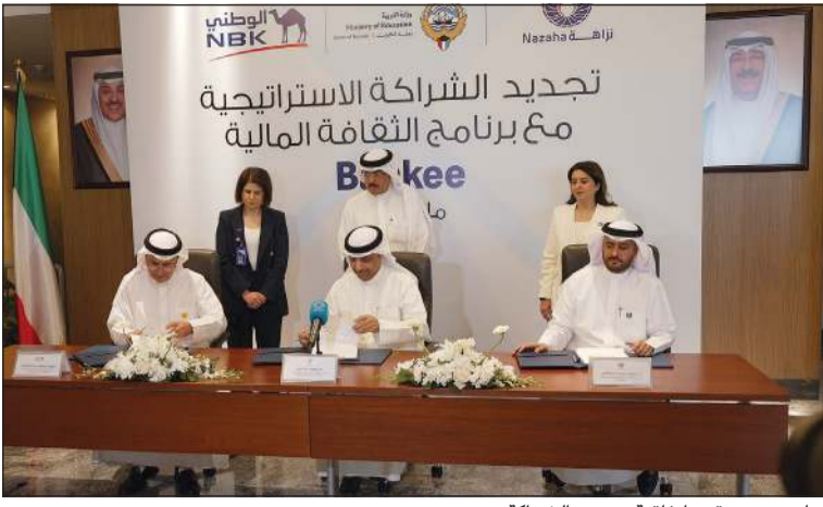
جانب من توقيع اتفاقية تجديد الشراكة