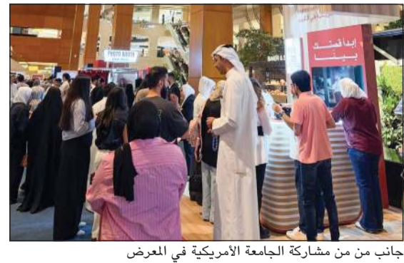
جانب من مشاركة الجامعة الأمريكية في المعرض