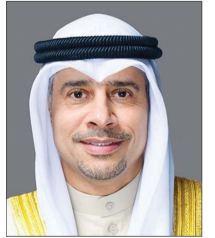
د. طارق الجلاهمة

أكد وزير الدولة لشؤون الشباب والرياضة د.طارق الجلاهمة أن تشريف سمو ولي العهد الشيخ صباح الخالد برعاية وحضور المباراة النهائية لكأس سموه اليوم الاثنين يجسد الدعم الكبير الذي توليه القيادة السياسية للقطاع الرياضي والشبابي. وقال الوزير الجلاهمة لـ «كونا» أمس إن دعم القيادة السياسية يعكس المكانة المتميزة التي تحظى بها الرياضة الكويتية باعتبارها ركيزة مهمة في دعم الطاقات الوطنية وتعزيز