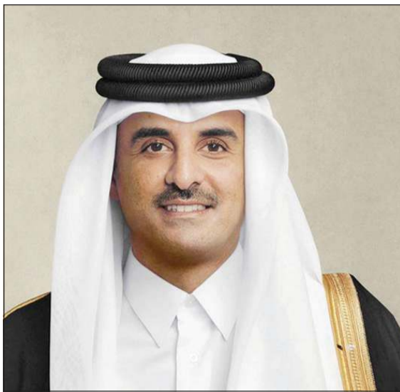
صاحب السمو الشيخ تميم بن حمد آل ثاني أمير دولة قطر