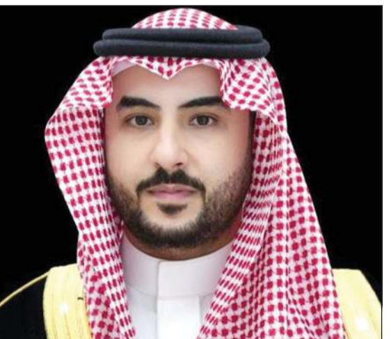
صاحب السمو الملكي الأمير خالد بن سلمان وزير الدفاع السعودي

الدفاع السعودي بمستشار الأمن القومي البريطاني في جدة. وقالت (واس) إنه جرى خلال اللقاء استعراض أوجه العلاقات السعودية-البريطانية والتعاون الثنائي بين البلدين الصديقين.