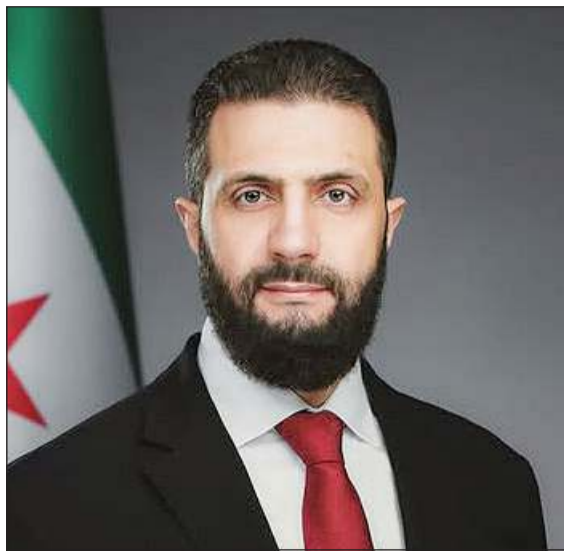
الرئيس السوري أحمد الشرع