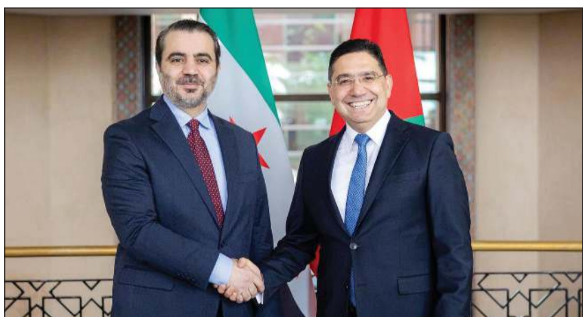
وزير الخارجية المغربي ناصر بوريطة مستقبلاً وزير الخارجية السوري أسعد الشيباني

في العديد من القطاعات. من جانبه، قال وزير الخارجية المغربي ناصر بوريطة: «سنشهد إعادة فتح سفارة سورية في المغرب كدليل على عودة العلاقات إلى طبيعتها بعد توقف لأكثر من 10 سنوات».