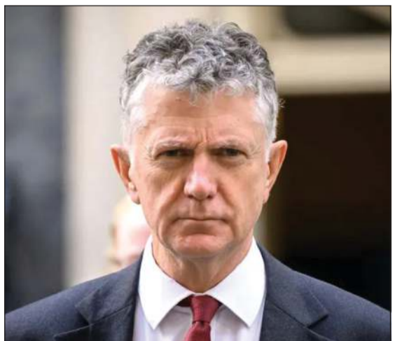
مستشار الأمن القومي البريطاني جوناثان باول