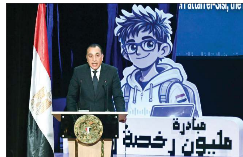
رئيس مجلس الوزراء د. مصطفى مدبولي خلال احتفالية صندوق تطوير التعليم

وأعرب الوزير خلال المؤتمر عن شكره للمغرب على إعادة العلاقات السياسية سريعاً بعد إسقاط النظام البائد، لافتاً إلى أنه جرى أول اتصال مع المغرب بعد التحرير بـ20 يوماً، وتم التأكيد حينها على