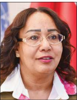
ممثل الأمين العام للأمم المتحدة لدى الكويت غادة الطاهر

وقالت الطاهر إن «الكويت برزت في طليعة دول المنطقة كطرف لا غنى عنه في دبلوماسية العصر الجديد عبر احتضان مفاوضات