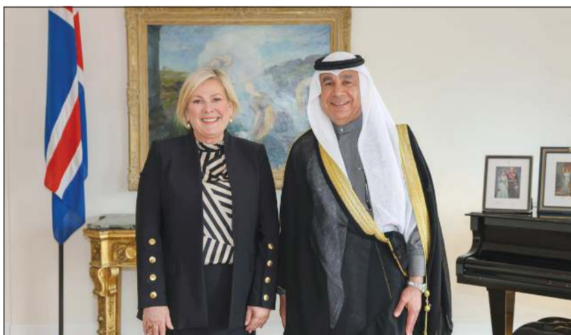
سفيرا بايرلندا محمد المحمد يقدم أوراق اعتماده إلى رئيسة آيسلندا هالا توماسدوتير سفيراً غير مقيم للكويت لدى بلاده.

سفيرا بايرلندا محمد المحمد يقدم أوراق اعتماده إلى رئيسة آيسلندا هالا توماسدوتير سفيراً غير مقيم للكويت لدى بلاده. وذكرت سفارتنا لدى آيرلندا، في بيان تلقت (كونا) نسخة منه أمس أوراق اعتماد جرت أمس في القصر الرئاسي بعاصمة آيسلندا ريكيافيك. ونقل السفير محمد خلال اللقاء تحيات صاحب السمو الأمير الشيخ مشعل الأحمد وسمو ولي العهد الشيخ صباح الخالد لرئيسة آيسلندا وتمنياتها لدولة آيسلندا وشعبها الصديق دوام التقدم والازدهار. وتم خلال اللقاء الإشادة بالعلاقات المتميزة بين الكويت وآيسلندا وتأكيد