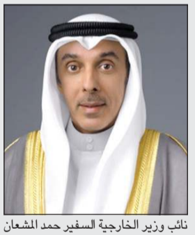
نائب وزير الخارجية السفير خالد بن مبارك الخالد

كونا- تلقى نائب وزير الخارجية السفير حمد المشعان اتصالا هاتفيا من نائب الأمين العام لجهات العمل الخارجي للشؤون السياسية بالمفوضية الأوروبية السفير أولوف سكوغ. وبحسب بيان صادر عن وزارة الخارجية، شهد الاتصال بحث العلاقات الثنائية بين الكويت والاتحاد الأوروبي وسبل تعزيزها في مختلف المجالات. وتناول الاتصال، وفق البيان، موقف الاتحاد الأوروبي الداعم والمتضامن مع الكويت في ظل الأحداث الجارية التي تشهدها المنطقة.