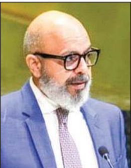
مندوبنا الدائم لدى الأمم المتحدة السفير طارق البناني

إذنا بانطلاق مرحلة جديدة من حضورها الفاعل في المجتمع الدولي، وتابع أنه «منذ أن رفع علم دولة الكويت في 15 مايو 1963، وللمرة الأولى عاليا بين أعلام الدول الأعضاء أمام المقر الرئيسي للأمم المتحدة في نيويورك، جسدت الكويت التزاما ثابتا بمبادئ ومقاصد ميثاق الأمم المتحدة وفي مقدمتها حفظ السلم والأمن الدوليين واحترام القانون الدولي وتعزيز الحوار والتعاون بين الدول وتسوية النزاعات السلمية». وأضاف السفير البناني أن ذلك الالتزام تجسد خلال الغزو العراقي الغاشم للكويت حين شكلت الأمم المتحدة، ومجلس الأمن الدولي على وجه الخصوص، إطارا دوليا حاسما للدفاع عن سيادة البلاد واستقلالها ووحدة أراضيها والتصدي لمحاولة محو كيان دولة عضو