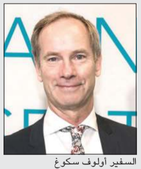
السفير أولوف سكوغ