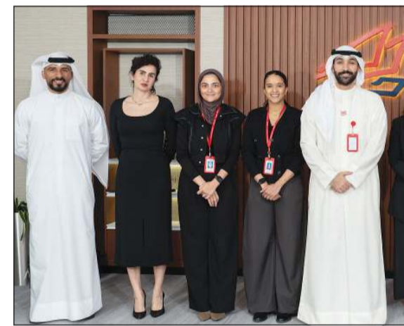
صورة جماعية لفريق بنك الخليج خلال السحب ربع السنوي الأول

ضمن جهوده المتواصلة لمكافحة عملائه، أجرى بنك الخليج أمس السحب ربع السنوي الأول لعام 2026، إلى جانب السحبوبات الشهرية لشهري فبراير ومارس، وذلك في المقر الرئيسي للبنك تحت إشراف مكاتب تدقيق عالمية، وتم بثه مباشرة عبر منصات التواصل الاجتماعي الخاصة بالبنك. وبلغ عدد الفائزين في سحبوبات الأمس 120 فائزاً، حصل كل منهم على جائزة قدرها 1000 دينار، فيما يتربع عملاء حساب «مليونير الدانة» الإعلان عن الفائز في سحب المليون دينار في 8 يوليو المقبل، بالإضافة إلى سحب شهر مايو في 10 يونيو، وسحب يونيو في 8 يوليو. وكان بنك الخليج قد توج 272 فائزاً من عملاء حساب الدانة في سحبوبات