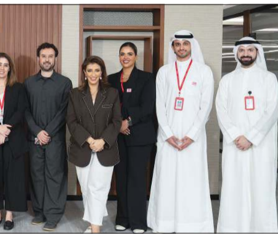
صورة جماعية لفريق بنك الخليج خلال السحب ربع السنوي الأول

ضمن جهوده المتواصلة لمكافحة عملائه، أجرى بنك الخليج أمس السحب ربع السنوي الأول لعام 2026، إلى جانب السحبوبات الشهرية لشهري فبراير ومارس، وذلك في المقر الرئيسي للبنك تحت إشراف مكاتب تدقيق عالمية، وتم بثه مباشرة عبر منصات التواصل الاجتماعي الخاصة بالبنك. وبلغ عدد الفائزين في سحبوبات الأمس 120 فائزاً، حصل كل منهم على جائزة قدرها 1000 دينار، فيما يتربع عملاء حساب «مليونير الدانة» الإعلان عن الفائز في سحب المليون دينار في 8 يوليو المقبل، بالإضافة إلى سحب شهر مايو في 10 يونيو، وسحب يونيو في 8 يوليو. وكان بنك الخليج قد توج 272 فائزاً من عملاء حساب الدانة في سحبوبات