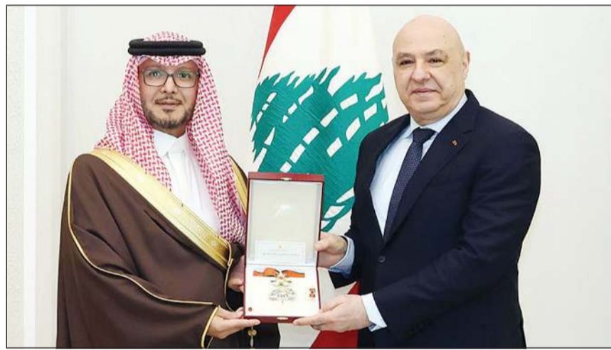
رئيس الجمهورية العماد جوزف عون يمنح السفير السعودي وليد البخاري وسام «الرز» من رتبة ضابط أكبر

بيروت - ناجي شربل وبولين فاضل استقبل رئيس الجمهورية العماد جوزف عون السفير السعودي وليد البخاري في زيارة وداعية، وقلده وسام أكبر، منوهاً به «الدور الذي أداه خلال فترة عمله في لبنان، والذي أسهم في تعزيز وتطوير العلاقات الأخوية بين البلدين الشقيقين في مختلف المجالات»، و«متمنياً له التوفيق في مهامه الجديدة». وأضاف: «أن لبنان إذ يثمن عالياً رعاية خادم الحرمين الشريفين الملك سلمان بن عبدالعزيز، يرى في الدور الريادي الذي يلعبه صاحب السمو الملكي الأمير محمد بن سلمان ولي العهد رئيس مجلس الوزراء السعودي رؤى طموحة لا تقتصر آثارها الإيجابية على المنطقة بأسرها بل تشمل التنمية والاستقرار». وأعرب الرئيس عون عن التزامه بتعزيز التعاون مع المملكة في مختلف المجالات، أملاً أن تستمر هذه العلاقات لما فيه خير البلدين الشقيقين. بدوره، شكر السفير البخاري لرئيس الجمهورية