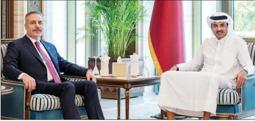
صاحب السمو الشيخ تميم بن حمد آل ثاني أمير دولة قطر مستقبلاً وزير خارجية تركيا هakan فیدان

وكالات: استقبل صاحب السمو الشيخ تميم بن حمد آل ثاني أمير دولة قطر، بمكتبه في قصر لوسيل، وزير خارجية تركيا هakan فیدان الذي أجرى مباحثات أيضاً مع الشيخ محمد بن عبد الرحمن بن جاسم آل ثاني، رئيس مجلس الوزراء وزير خارجية قطر. وقال الديوان الأميري القطري أن الأمير وفيدان استعرضا علاقات التعاون الاستراتيجي بين البلدين الشقيقين وسبل دعمها وتعزيزها. كما جرت مناقشة تطورات الأوضاع في المنطقة، لاسيما المتعلقة بوقف إطلاق النار بين الولايات المتحدة الأميركية وإيران، والجهود المبذولة من أجل خفض التصعيد وترسيخ مبدأ الحل الدبلوماسي بما يسهم في تعزيز الأمن والاستقرار الدولي. وشدد على أن المنطقة تمر بظروف دقيقة تتطلب التشاور مع الدول الشقيقة والصديقة، مؤكداً الاستمرار في التنسيق مع دول مجلس التعاون والمنطقة