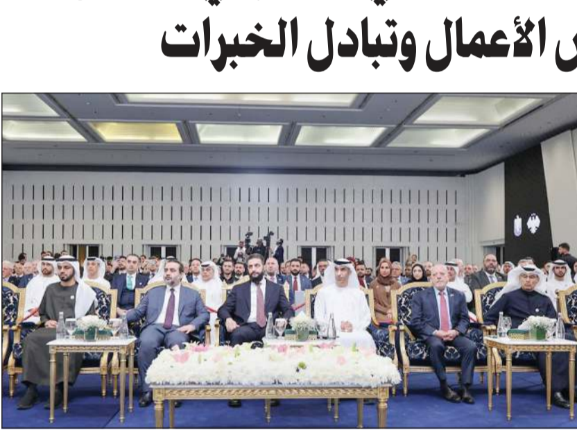
الرئيس أحمد الشرع يتوسط وزير التجارة الخارجية الإماراتي ثاني بن أحمد الزيودي ووزير الخارجية أسعد الشيباني بحضور وفدَي البلدين (سانا)

وكالات: عقدت في دمشق أمس، بحضور الرئيس أحمد الشرع، فعاليات اليوم الثاني من المنتدى الاستثماري السوري - الإماراتي الأول في قصر الشعب بدمشق، وتضمنت جلسات حوارية مناقشة التعاون الاستثماري والاقتصادي بين البلدين في مختلف المجالات، بحسب وكالة الأنباء السورية (سانا). وضم الوفد الإماراتي المشاركة في المنتدى وزير التجارة الخارجية الإماراتي ثاني بن أحمد الزيودي، ورئيس الهيئة العامة للشؤون الإسلامية الدرعي، بالإضافة إلى عدد من رجال الأعمال المقربين في الإمارات من مختلف القطاعات الاستثمارية والاقتصادية. وقال وزير التجارة الخارجية في الإمارات في كلمته أمس: «سعدني أن أكون معكم في دمشق مدينة التاريخ والحضارة التي كانت عبر العصور جسراً يربط حضارات العالم شرقاً وغرباً، مؤكداً أن المرحلة الراهنة من تعافي سورية وعودتها إلى مسار النمو تفتح آفاقاً واسعة لتوطيد التعاون في مجالات حيوية أبرزها إعادة الإعمار». وأوضح الزيودي أن ذلك