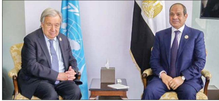
الرئيس عبدالفتاح السيسي خلال لقائه الأمين العام للأمم المتحدة أنطونيو غوتيريش على هامش قمة «أفريقيا-فرنسا» في نيروبي

القاهرة - خديجة حمودة بحث الرئيس المصري عبدالفتاح السيسي وسكرتير عام الأمم المتحدة أنطونيو غوتيريش أمس التطورات الإقليمية الحالية وفي مقدمتها الأزمة الإيرانية. وذكر المتحدث باسم الرئاسة المصرية السفير محمد الشناوي، في بيان صحافي، أن ذلك جاء خلال لقاء جمع بين الجانبين خلال قمة «أفريقيا-فرنسا» المنعقدة في العاصمة الكينية نيروبي. وقال البيان أن اللقاء شهد توافقاً في الرؤى بشأن خطورة حالة عدم اليقين الحالية وتداعياتها السلبية على المنطقة والعالم، مع التأكيد على أولوية دعم الجهود الرامية للتوصل إلى تسويات سلمية للنزاعات بما يحافظ على سيادة الدول ومقدرات شعوبها. وأضاف أن الرئيس السيسي استعرض مساعي مصر لاستعادة الأمن والاستقرار الإقليميين بالتنسيق مع الأطراف الدولية والإقليمية