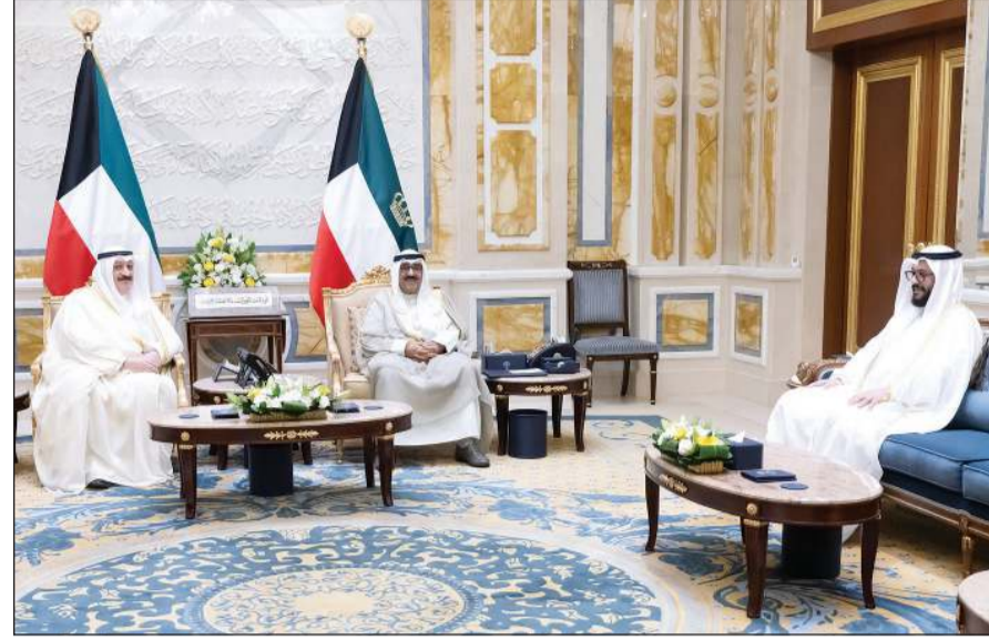
صاحب السمو الأمير الشيخ مشعل الأحمد مستقبلاً وزير الصحة د. أحمد العوضي ووكيل وزارة الصحة الشيخ د. سلمان خليفة عبدالله الصباح

كوونا: استقبل صاحب السمو الأمير الشيخ مشعل الأحمد وزير الصحة د. أحمد العوضي، حيث قدم له رسالة خطية من الرئيس الموريتاني محمد ولد الشيخ عبد الله الصباح، وذلك بمناسبة تعيينه في منصبه الجديد. كما استقبل سمو ولي العهد الشيخ صباح الخالد وزير الصحة د. أحمد العوضي، حيث قدم له رسالة خطية من الرئيس الموريتاني محمد ولد الشيخ عبد الله الصباح، وذلك بمناسبة تعيينه في منصبه الجديد. من جهة أخرى، تلقى صاحب السمو الأمير الشيخ مشعل الأحمد رسالة خطية من الرئيس محمد ولد الشيخ الغزواني، رئيس الجمهورية الإسلامية الموريتانية الشقيقة، تتصل بالعلاقات الثنائية الوثيقة التي تربط البلدين الشقيقين وأطر تعزيزها وتنميتها. تسلم الرسالة وزير الخارجية الشيخ جراح الجابر أثناء استقباله د. محمد سالم ولد مرزوك، المبعوث الخاص لرئيس الجمهورية الإسلامية الموريتانية الشقيقة، وزير الشؤون الخارجية والتعاون الأفريقي والموريتانيين في الخارج. كما جرى خلال اللقاء استعراض العلاقات الثنائية بين البلدين، وآخر التطورات على الساحتين الإقليمية والدولية، إلى جانب تبادل وجهات النظر حول القضايا ذات الاهتمام المشترك.