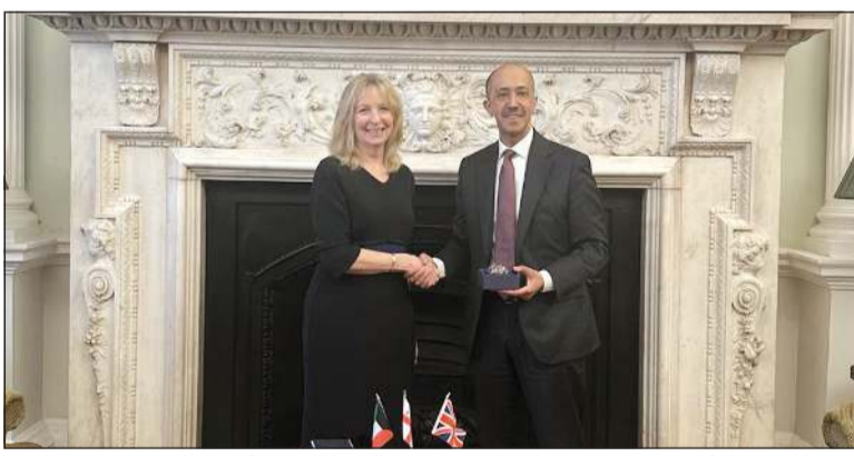
سفيرنا لدى المملكة المتحدة بدر المنىخ خلال اللقاء مع عمدة الحي المالي لندون لوردر سوزن لانجلي

لندن - كوونا: التقى سفيرنا لدى المملكة المتحدة بدر المنىخ عمدة الحي المالي لندون لوردر سوزن لانجلي، حيث استعرضا أوجه العلاقات التجارية والاستثمارية بين دولة الكويت والمملكة المتحدة. وقالت سفارتنا لدى لندن في بيان إن السفير المنىخ واللورد سوزن لانجلي بحثا سبل تعزيز العلاقات وتطويرها، بالإضافة إلى بحث الخدمات والتسهيلات التي يقدمها البلدان للمستثمرين الأجانب بما يسهم في دعم بيئة الأعمال وتشجيع الاستثمارات المتبادلة.