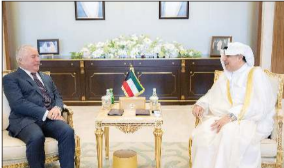
وزير شؤون الديوان الأميري الشيخ حمد جابر العلي مستقبلاً سفير طاجيكستان وعميد السلك الدبلوماسي لدى البلاد السفير د. زيد الله زبيدوف