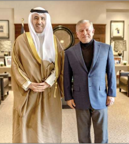
العاهل الأردني الملك عبدالله الثاني خلال استقبال سفيرنا لدى الأردن السفير محمد المري

عمان - كوونا: استقبل العاهل الأردني الملك عبدالله الثاني سفيرنا لدى الأردن السفير محمد المري بمناسبة قرب انتهاء فترة عمله. وقال المري في تصريح لـ (كوونا) عقب اللقاء إنه نقل تحيات صاحب السمو الأمير الشيخ مشعل الأحمد وسمو ولي العهد الشيخ صباح الخالد، إلى العاهل الأردني الملك عبدالله الثاني وتمنيات سموهما للأردن، بقيادة وحكومة وشعبا، دوام التقدم والازدهار. وأكد أن العلاقات الكويتية - الأردنية تعد نموذجا رائداً يحتذى في مختلف المجالات السياسية والاقتصادية والعسكرية والثقافية.