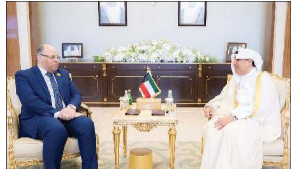
وزير شؤون الديوان الأميري الشيخ حمد جابر العلي مستقبلاً السفير المصري محمد جابر أبو الوفا

فترة عمله لدى البلاد وبإسهاماته البارزة في تعزيز أواصر العلاقات المتميزة والدفع بها نحو آفاق أرحب. وتمن الدور البناء الذي قام به سعادته بصفتة عميدا للسلك الدبلوماسي في توطيد التواصل بين البعثات الدبلوماسية المعتمدة لدى دولة الكويت، متمنيا لسعادته دوام التوفيق والنجاح في مهامه المستقبلية. كما استقبل وزير شؤون الديوان الأميري الشيخ حمد جابر العلي سفير جمهورية مصر العربية الشقيقة لدى دولة الكويت محمد جابر أبو الوفا، وجرى خلال اللقاء استعراض