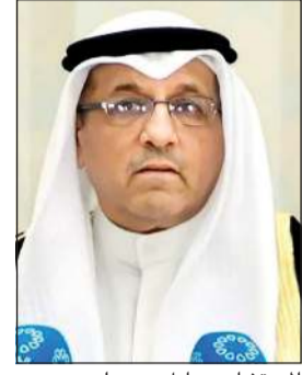
المستشار د. عادل بورسلي بمقر مجلس القضاء الأعلى في قصر العدل بمناسبة صدور مرسوم بترقية 29

مصلحة الكويت فوق كل الاعتبارات وعلينا حراستها وحمايتها والحفاظ على أمنها القضائي والقانوني