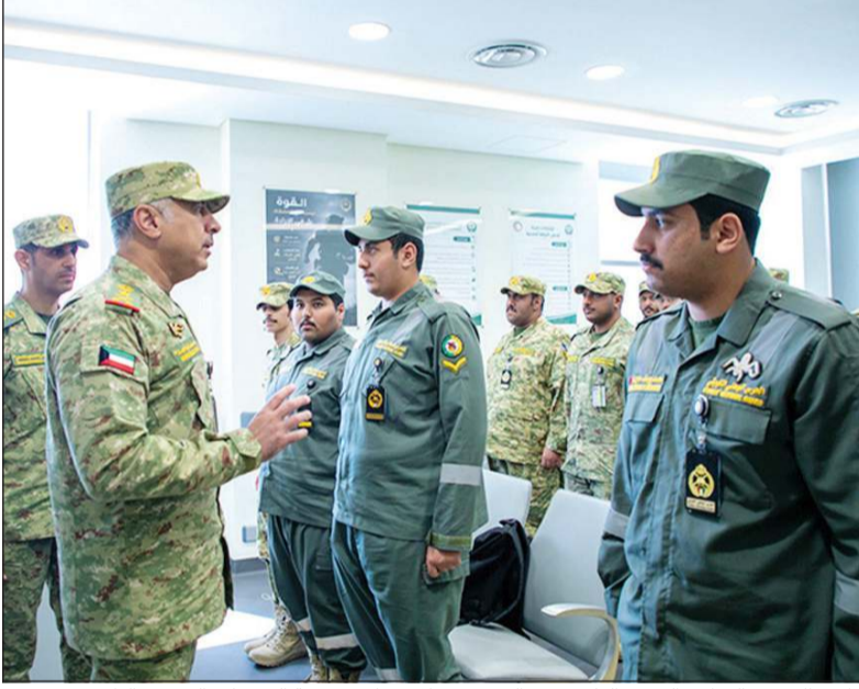
وكيل الحرس الوطني الفريق الركن حمد البرجس خلال زيارة تفقدية إلى مركز الفحص الطبي

قام وكيل الحرس الوطني الفريق الركن حمد البرجس، بزيارة تفقدية إلى مركز الفحص الطبي، للاطلاع على سير العمل وألية الفحوصات المتعلقة بقياس كتلة الجسم، والتأكد من دقة الإجراءات المتبعة في تنفيذها، وكان في استقباله قائد الإسناد العميد م. طلال عيسى السعدي. واستمع الوكيل خلال الزيارة إلى شرح حول آلية العمل والإجراءات المتبعة في إنجاز الفحوصات الطبية وقياس كتلة الجسم، مؤكداً أهمية مواصلة العمل بروح المسؤولية والالتزام، وتسخير جميع الإمكانيات لتقديم أفضل الخدمات الطبية بكفاءة عالية، بما يساهم في تعزيز الجاهزية الصحية والبدنية للمنتسبين. وأشاد بالجهود التي يبذلها منتسبو المركز، وما يقدمونه من عمل يعكس مستوى الانضباط والجاهزية والكفاءة في أداء المهام.