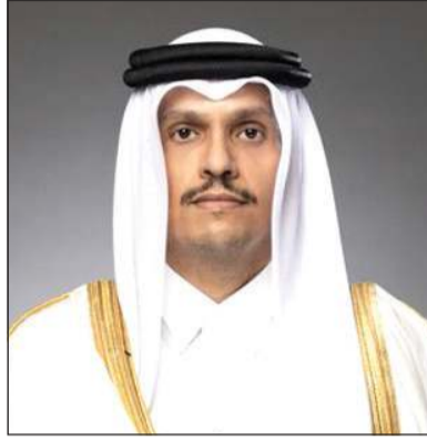
رئيس مجلس الوزراء وزير الشؤون الخارجية والتعاون الأفريقي والموريتانيين في الخارج د. محمد سالم ولد مرزوك