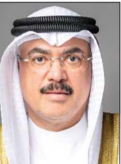
وزير التربية م. سيد جلال الطيباني

على أن يكون الخميس الموافق 21 الجاري نهاية دوام المتعلمين في صفوف المرحلة المتوسطة للفصل الدراسي الثاني، على أن ينتهي دوام الهيئة الإدارية والتعليمية في مدارس المرحلة المتوسطة يوم الأحد الموافق 14 يونيو، باستثناء المكلفين بأعمال امتحانات الثانوية العامة. وفيما يتعلق بالمرحلة الثانوية، تقرر أن تبدأ امتحانات نهاية الفصل الدراسي الثاني للصفين العاشر والحادي عشر الثانوي اعتباراً من الأربعاء الموافق 3 يونيو 2026 حتى الإثنين الموافق 15 يونيو، فيما تنطلق امتحانات الصف الثاني عشر الثانوي من الأربعاء الموافق 17 يونيو 2026 حتى الإثنين الموافق 29 يونيو 2026. كما حدد القرار يوم الأحد