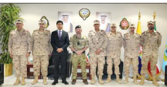
مستشار أول الدفاع البريطاني للشرق الأوسط وشمال أفريقيا الفريق الركن بحري إدوارد ألجربين والسفير البريطاني قنسى رشيد وملحق الدفاع البريطاني العقيد الركن بحري نيل ماريوت خلال الزيارة

الدفاعية طويلة الأمد بين بلدينا، والزمانا المشترك بحماية الكويت وجميع من يعيش على أرضها، وخلال زيارتنا لرفقة الفريق البحري إدوارد ألجربين إلى قيادة الدفاع الجوي الكويتية، اطلعنا عن قرب على الاحترافية العالية والقدرات المتميزة التي تتمتع بها القوات المسلحة الكويتية، إلى جانب مستوى التعاون الوثيق بين الفرق البريطانية والكويتية.