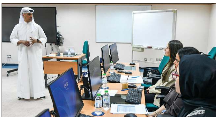
مركز «كونا» لتطوير القدرات الإعلامية أطلق دورة تدريبية بعنوان «كتابة الأخبار المتقدمة» باللغة الإنجليزية

تدريباً وتجارب عملية تهدف إلى تعزيز المهارات المهنية الصحافية للمشاركين وتطوير قدراتهم العملية في مختلف مجالات العمل الإعلامي. ويعتبر مركز «كونا» لتطوير القدرات الإعلامية، الذي أسس في ديسمبر 1995، من أبرز مراكز التدريب الإعلامي وقدم مئات البرامج التدريبية في مجالات إعلامية متنوعة بهدف تطوير القدرات والإمكانات الإعلامية والارتقاء بمستوى العمل الإعلامي المهني.