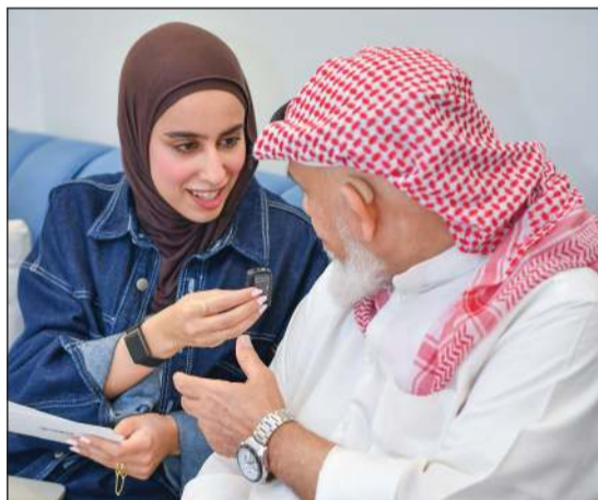
أحد نزلاء المركز