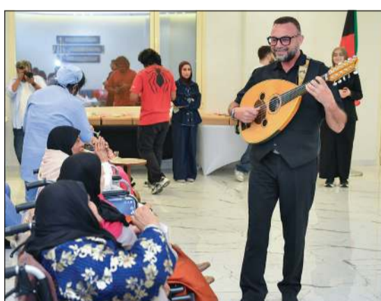
عزف حي آلة العود

وتؤكد شركة ماكفم للسيارات، إحدى شركات أولاد علي الغانم للسيارات، من خلال هذه المبادرة التزامها المستمر بالقيام بدور مجتمعي يتجاوز إطار الأعمال، عبر مبادرات إنسانية تهدف إلى نشر الأثر الإيجابي وتعزيز قيم الرحمة والتقدير والتواصل بين أفراد المجتمع.