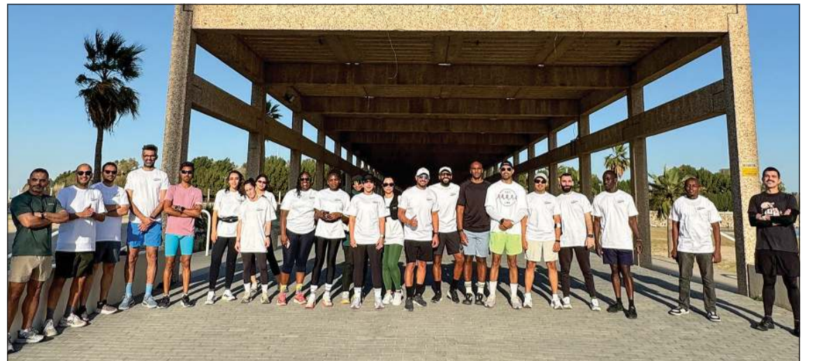
المشاركين في المبادرة

في إطار التزامها المستمر بدورها كشركة مسؤولة اجتماعياً، أطلقت Ooredoo الكويت مبادرة Tempo Run Club، وهي برنامج مجتمعي واسع النطاق يهدف إلى تعزيز الصحة العامة ونمط الحياة النشط، وبناء روابط اجتماعية من خلال جلسات جري أسبوعية منظمة تقام في مواقع مختلفة داخل الكويت. ولا تعد هذه المبادرة مجرد نشاط رياضي، بل تمثل حركة مجتمعية مستدامة تجمع أفراداً من مختلف الأعمار ومستويات اللياقة البدنية، في بيئة شاملة ومحفزة تشجع على المشاركة والتفاعل الإيجابي، وتعكس هذه الخطوة رؤية Ooredoo الكويت الأوسع التي تتجاوز خدمات الاتصالات التقليدية نحو المساهمة الفعالية في بناء مجتمع أكثر صحة وترابطاً ونشاطاً.