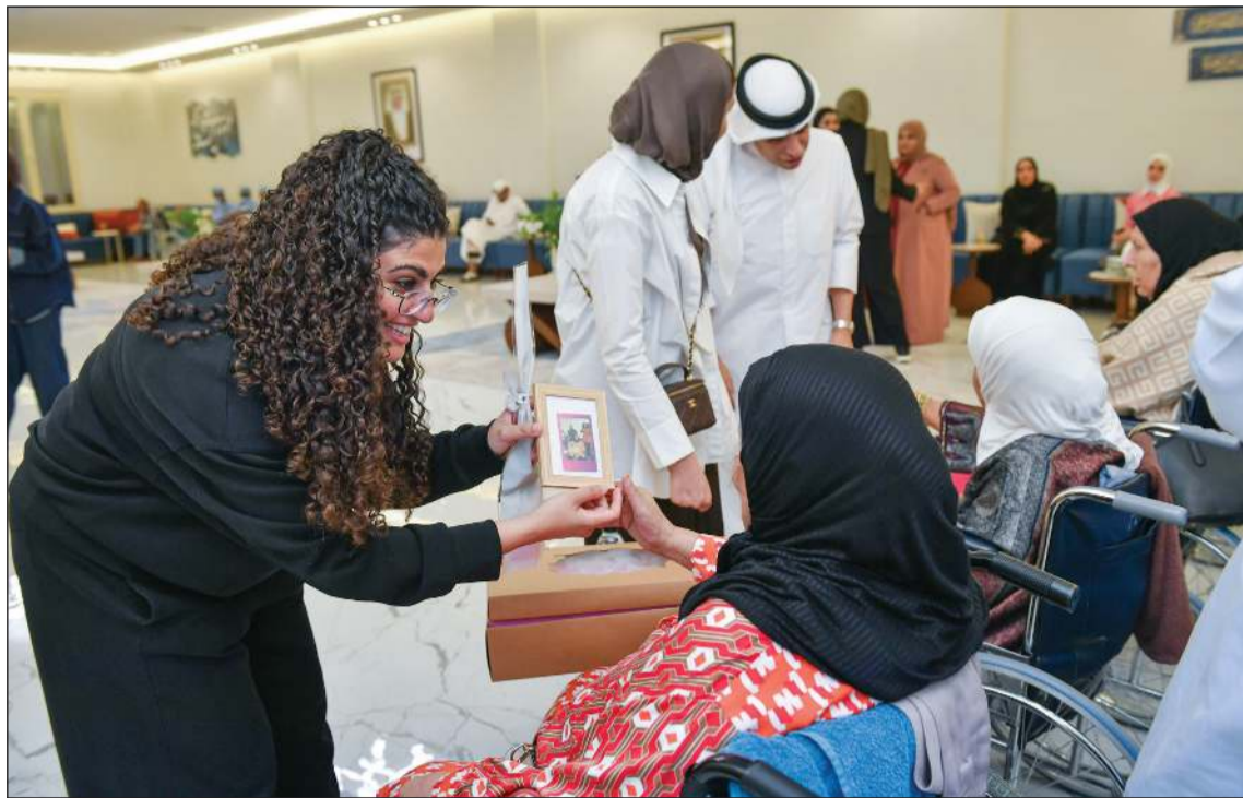
تقديم هدايا لنزلاء المركز

في 5 مايو 2026، بمناسبة اليوم العالمي لدور الرعاية وانطلاقاً من إيمانها بأهمية التواصل الإنساني ورد جميل لكبار السن، نظمت شركة GWM زيارة خاصة إلى مركز فرح التخصصي لرعاية وتأهيل المسنين، في مبادرة اجتماعية حملت الكثير من المحبة والاهتمام واللحظات الدافئة.