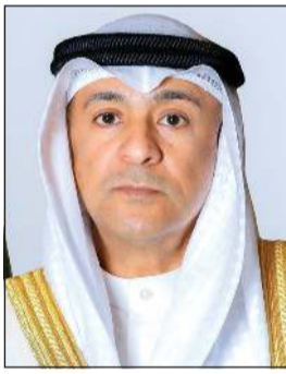
الأمين العام لمجلس التعاون الخليجي جاسم البيديوي

عدد من الطائرات المسيرة المعادية، معتبرا ذلك خرقا صارخا للقانون الدولي وميثاق الأمم المتحدة وانتهاكا سافرا لسيادة دولة الكويت الشقيقة وتهديدا لأمنها واستقرارها وسلامة أراضيها. وأكدت وزارة الخارجية الأردنية في بيان صحافي رفض الأردن واستنكاره هذا الاعتداء، مشددة على تضامن الأردن المطلق مع دولة الكويت ووقوفه الكامل معها في كل ما تتخذه من خطوات لحماية سيادتها وأمنها وسلامة مواطنيها والمقيمين فيها.