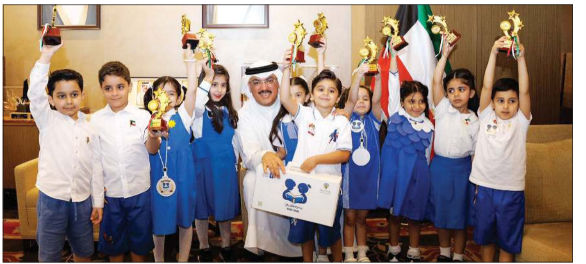
وزير التربية م.سيد جلال الطبطبائي خلال تكريم الفائزين بالمراكز الأولى في مبادرة «طفل يقرأ»

مرحلة رياض الأطفال تمثل الأساس الحقيقي لبناء شخصية المتعلم وتنمية قدراته ومهاراته