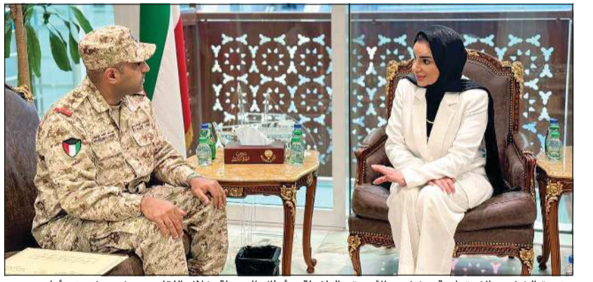
وزيرة الشؤون الاجتماعية وشؤون الأسرة والطفولة د.أمل الحويلة خلال اللقاء مع رئيس فريق «أمان»

في مواجهة الطوارئ. وأوضحت أنه تم استعراض أبرز الجهود المبذولة لإنشاء المركز، إضافة إلى مناقشة مراحل العمل الحالية وآليات التنسيق والتعاون بين الجهات المعنية بما يدعم تكامل الأدوار خلال الأزمات.