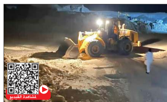
رجال المباحث تحفظوا على أليات ثقيلة تستخدم في السرقة

تستخدمان في استخراج ونقل الرمال، كما لقي القبض على أربعة متهمين أثناء إدارتهم الموقع وممارستهم أعمال البيع بصورة غير مشروعة، وتبين أن أحدهم سوري الجنسية واثنين من الجنسية المصرية، بالإضافة إلى متهم بنغلاديشي تبين أنه مطلوب وصادرة بحقه أوامر ضبط وإحضار وبلاغ تغيب.