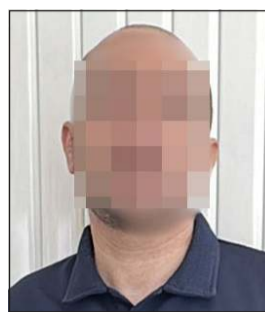
المتهم جار تسليمه إلى الكويت لاستكمال تنفيذ الحكم القضائي

وقالت «الداخلية» في بيان إن ذلك جاء بالتنسيق المباشر بين الإدارة العامة للشرطة الجنائية العربية والدولية (الإنتربول الكويتي)