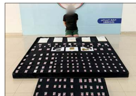
شبو وبودرة اللاربيكا من بين المضبوطات

أعلنت وزارة الداخلية أن الإدارة العامة لمكافحة المخدرات وجهت ضربات أمنية متفرقة أسفرت عن ضبط 10 متهمين في قضايا اتجار وتعاط، وبحوزتهم نحو 3 كيلو غرامات من المواد المخدرة، شملت كيلو و10 غرامات من مادة الشبو وكيلويين من بودرة اللاربيكا، إضافة إلى 2218 كبسولة لاربيكا و4 أقراص كبتاغون ومواد مؤثرة عقلياً. وقالت الوزارة في بيان إن الضبطيات شملت أيضاً 60 زجاجة خمر و3 أسلحة نارية وميزانين حساسين، إلى جانب 8179 ديناراً يشتبه بأنها حصيلة الاتجار بالمخدرات، مؤكدة إحالة المتهمين والمضبوطات إلى جهات الاختصاص لاتخاذ الإجراءات القانونية اللازمة.