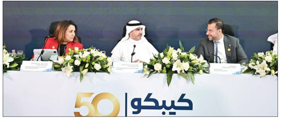
الشيخ عبدالله ناصر صباح الأحمد والشيخة اادانا ناصر صباح الأحمد ومصطفى الشامي خلال اجتماع الجمعية العمومية للمجموعة