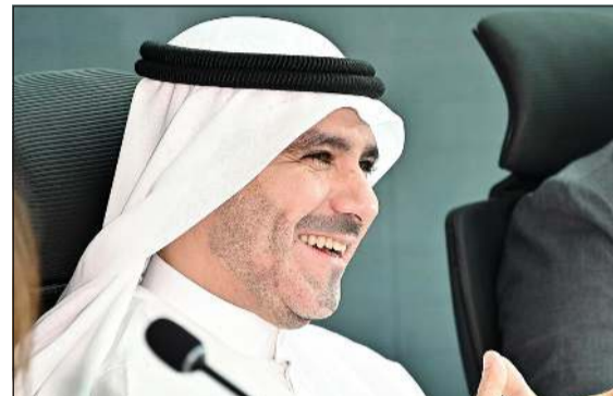
الشيخ عبدالله ناصر صباح الأحمد

وقالت الرئيسة التنفيذية للمجموعة «واصلت شركات