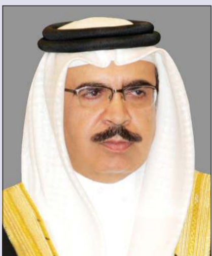
وزير الداخلية بمملكة البحرين الفريق أول الشيخ راشد بن عبدالله آل خليفة

الكويت تُسرّع التحول إلى «الدفع الإلكتروني».. 112,6 ألف جهاز دفع و7,72 ملايين بطاقة مصرفية سارية