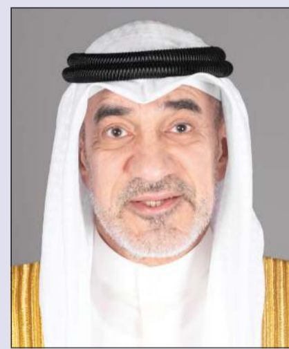
النائب الأول لرئيس مجلس الوزراء وزير الداخلية الشيخ فهد يوسف

أعلن وزير العدل المستشار ناصر السميح، عن إطلاق خطة شاملة لتطوير الإدارة العامة للخبراء، في مقدمتها استكمال تكويت الإدارة بالكامل اعتباراً من أول أغسطس 2026، من خلال إنهاء خدمات جميع غير الكويتيين العاملين في وظائف الخبراء الهندسيين والمحاسبين والباحثين القانونيين. في خطوة تضع الكفاءة الوطنية في قلب المنظومة الفنية المساندة للقضاء، وتنقل مهام الخبرة بمختلف تخصصاتها إلى خبراء كويتيين بالكامل، ورفع جودة التقارير الفنية وتعزيز الثقة في مخرجاتها. وتضمنت الخطة تفعيل نظام البصمة اعتباراً من 1 يونيو المقبل، إلى جانب تخصيص أيام مفتوحة أسبوعية لرئيس الإدارة العامة للخبراء بالتكليف د. فواز جاسم بوذي ونوابه لشؤون المحافظات، للاستماع المباشر إلى ملاحظات الأفراد والمحامين. وكشف السميح عن أن المرحلة المقبلة ستشهد تطوير خدمات الإدارة الإلكترونية، وإعادة توزيع العمل بين الخبراء بكفاءة أعلى وعدالة وكفاءة، وتطبيق تدوير دوري للخبراء لترسيخ الشفافية ورفع مستوى الأداء، مؤكداً أن تطوير هذه الإدارة يمثل ركيزة أساسية في مسيرة تحديث منظومة العدالة في الكويت.