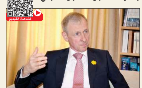
السفير البلجيكي لدى البلاد كريستيان دومز (يمين غوزال)

أكد أنها أدارت الأزمة بحكمة والهجمات الإيرانية على دول الخليج صدمة كبرى وانتهك صرخ للقانون الدولي