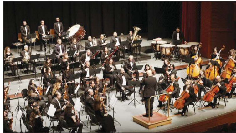
الفرقة السيمفونية الوطنية السورية