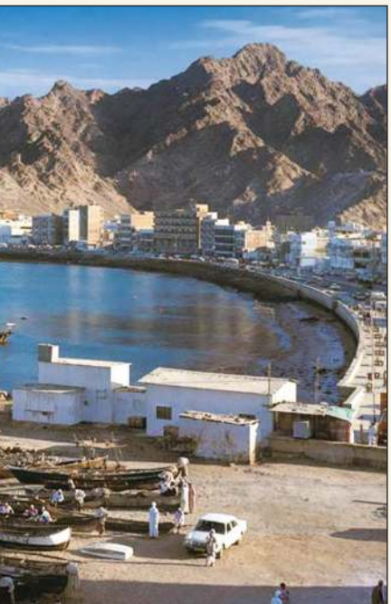
ميناء مسقط كما رصدهت كاميرا «العربي» في أوائل 1980

لقد كان من الصعب أن أعثر على هذا الاكتشاف الذي عبر عن قيمة مجلة العربي، ودورها المهم في التعريف ببلاد العرب كافة، لولا أن أحد أصدقائي الأعمى لفت نظري إليه، ثم شاهدته في بعض مواقع الاتصال، ولكن الأمر فيها لم يخرج عن مشاهدة غلاف العدد المقصود.