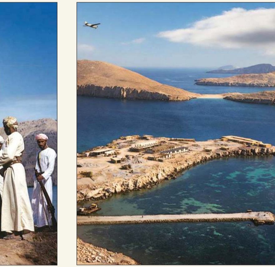
لقطة من الجو لجزيرة الغنایم حصن المضيق وكانها سيف يمتد إلى قلب مياهه الداكنة