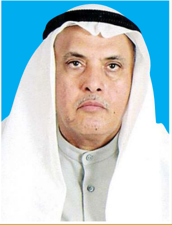
بقلم: د. يعقوب يوسف الفنيم

عشنا - ولا تزال نعيش - أياما تحيط بنا خلالها نذر الحرب من كل جانب، ومع ذلك فإن ما نعانيه مقدور عليه، بإذن الله تعالى، فالضربات التي توجه إلينا وإلى إخواننا في دول الخليج العربي ليست الحرب، ولكنها نذرها، وإصابتها ليست بقدر ما يروجوه مطلق شرارتها. ولذلك فإننا نستطيع أن نقول إنها نذر يصدرها طائش فقد صوابه، فليس له من عمل إلا العتب بسلاحه حتى ولو كان يوجهه إلى من كانوا له أصدقاء. أثمر الآن غير مخيف، ولكن نذر الحرب العالمية الثالثة هي التي تخيفنا وتجعلنا نتوخى الحذر في كل خطوة نخطوها، لأن هذه الحرب - إن حدثت - فسوف تكون حربا لا تبقى ولا تذر، وليس بمستبعد أن يجري خلالها استعمال كافة الأسلحة المدمرة بما في ذلك الأسلحة الذرية والكيميائية.