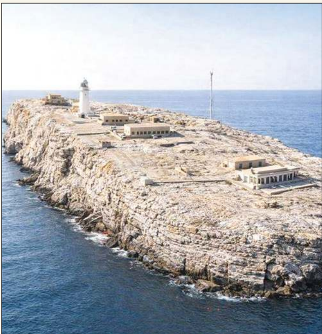
ولقطة من الجو لجزيرة سلامة مفتاح المضيق ويظهر فوقها الفئار الذي ينظم حركة الملاحة

الطائرة صغيرة وتحمل 16 مقعدا، ولها ميزة أنها لا تحتاج إلى مهبط طويل خلال هبوطها وإقلاعها وتصلح للمناطق الجبلية مثل رأس مسندم...».