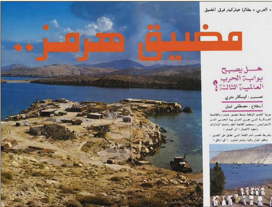
النبوءة.. مضيق هرمز هل يكون بوابة الحرب العالمية الثالثة؟