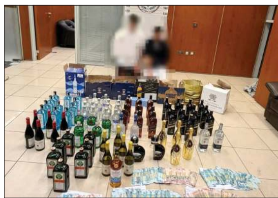
المتهمان وامامهما الخمر المضبوطة وحصيله البيع

اعترفا بحياتهما بقصد الاتجار، كما تبين أن قائد المركبة صادر بحقه أمر ضبط واحضار. وتمت إحالة المتهمين والمضبوطات مالي قدره 4710 دنانير، وبمواجهتهما،