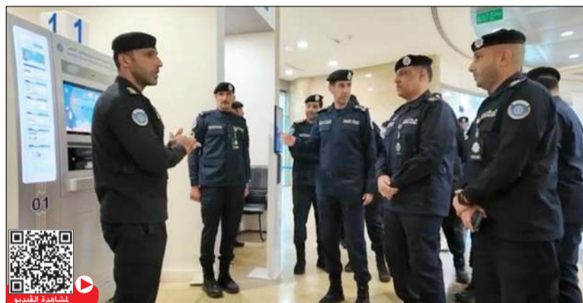
أحد ضباط قطاع الجنسية يستعرض أبرز الإحصائيات والإنجازات المحققة