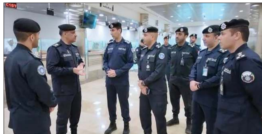
وكيل وزارة الداخلية اللواء عبدالوهاب الوهيب يستمع من رئيس قطاع شؤون الجنسية والإقامة العميد فواز الرومي إلى آلية العمل في قطاع الجنسية بالشويخ

وشملت الجولة متابعة الإجراءات الخاصة بملف الجنسية الكويتية، والوقوف على آلية التعامل مع ملفات التزوير، موجها بضرورة استيفاء كل الأدلة التي تثبت العلياء للجنسية، دعماً لاستمرارية تنفيذ التوجيهات السامية والمحافظة على الهوية الوطنية. وأشار اللواء عبدالوهاب الوهيب إلى أهمية مواصلة تطوير منظومة العمل، والالتزام بتطبيق القوانين واللوائح،