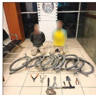
متهمان من بين الموقوفين الثلاثة وامامهما المسروقات

المتهم والمركبة المستخدمة في عملية السرقة. وتمت إحالة المتهمين والمضبوطات المسروقة إلى جهة الاختصاص لاتخاذ الإجراءات القانونية اللازمة بحقهم. هذا، وأكدت وزارة الخارجية على القانون، والتصدي لكل من تسول له نفسه المساس بالملكيات العامة والخاصة أو الإخلال بالأمن والنظام العام.