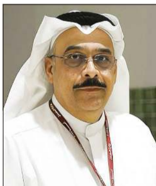
المستشار نصر آل هيد

ألف دينار بالتزوير في كشوفات الحضور والانصراف، في حين اتهمت الثالثة بالاستيلاء بالتزوير، على نحو 77 ألف دينار، والرابع مهندس اتهم بالاستيلاء على نحو 80 ألف دينار. وكانت وزارة الصحّة قد أجرت تحقيقاً إدارياً بشأن التلاعب في كشوفات الحضور والانصراف بتزوير بصمة الدوام. يشار إلى أن محكمة الجنايات قضت حضورياً بحبس المتهمين الأول والثاني والثالثة سبع سنوات مع الشغل والنقاز وعزلهم من الوظيفة والزام الأول برد نحو 260 ألف دينار، والثاني برد نحو 101 ألف دينار، والثالثة برد نحو