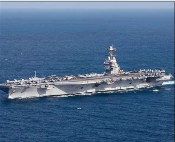
حاملة الطائرات الأميركية «يو إس إس جيرالد فورد»

واشنطن - أ.ف.ب: غادرت حاملة الطائرات الأميركية «جيرالد فورد» البحر المتوسط أمس، بحسب موقع تتبع الملاحية البحرية «مارين ترافيك». وأظهرت صور نشرها مصورون هواة على مواقع التواصل الاجتماعي حاملة الطائرات الأميركية، وهي الأكبر في العالم، تعبر مضيق جبل طارق باتجاه الغرب وعلى متنها عشرات الطائرات المقاتلة المنتشرة على سطحها. وتمضي «يو إس إس جيرالد فورد» شهرها العاشر في البحر، في أطول انتشار لحاملة طائرات أميركية منذ نهاية الحرب الباردة، وفق المعهد البحري الأميركي. ومن المقرر أن تعود «جيرالد فورد» إلى نورفولك، حيث ميناء مركزها في ولاية فرجينيا على الساحل الشرقي للولايات المتحدة، بحسب معلومات نشرتها صحيفة «وول ستريت جورنال» و«واشنطن بوست».