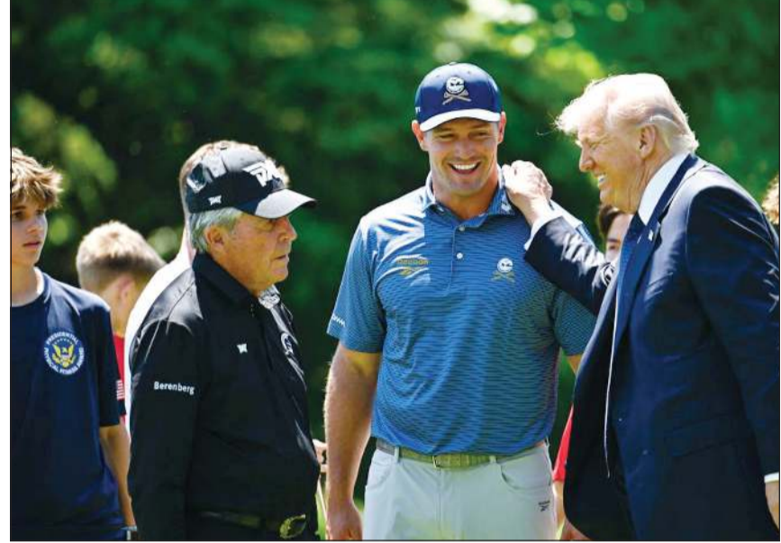
الرئيس دونالد ترامب مع لاعبي الغولف برايسون ديشامبو وغاري بلاير خلال نشاط في البيت الأبيض

وقال مسؤول أميركي لوكالة فرانس برس الجمعة الفائتة إن نحو عشرين سفينة حربية أميركية، بينها حاملتا الطائرات «أبراهام لينكولن» و«جورج بوش»، لاتزال منتشرة في المنطقة.