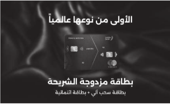
الأولى من نوعها عالمياً