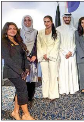
إداريو «المركز» و«إنفست جي بي» في صورة جماعية على هامش الندوة

قدم فريق الاستثمار العقاري في شركة المركز المالي الكويتي «المركز» ندوة مشتركة مع شركة الخليج كابيتال للاستثمار «إنفست جي بي»، الذراع الاستثمارية لبنك الخليج، حول أحدث مستجدات صندوق المركز العقاري. وجاءت الندوة ضمن سلسلة من الندوات الدورية التي يقدمها «المركز» مع شركة «إنفست جي بي»، بهدف تعزيز المعرفة الاستثمارية المتخصصة بالصندوق وتمكين مديري الثروات من عرض إستراتيجيته وقيمه الاستثمارية بكفاءة أعلى، مما يعكس على جودة الخدمات المقدمة للعملاء.