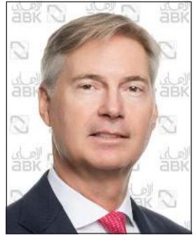
جيل جان فان دير تول