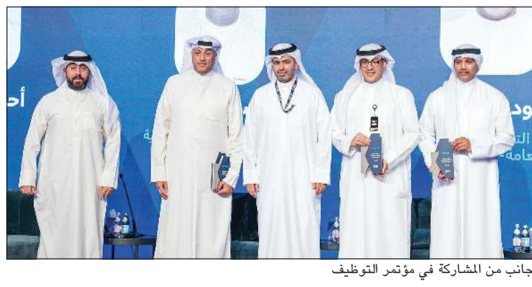
جانب من المشاركة في مؤتمر التوظيف