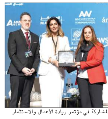
المشاركة في مؤتمر ريادة الأعمال والاستثمار