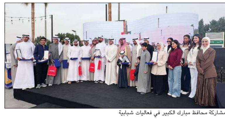
مشاركة محافظ مبارك الكبير في فعاليات شبابية