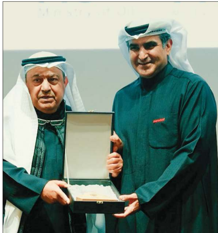
تكريم الرئيس التنفيذي من قبل وزير النفط

تواصل Ooredoo الكويت العمل على تعزيز مكانتها كشريك وطني فاعل، من خلال الابتكار، وتوسيع شراكاتها، وإطلاق مبادرات نوعية تسهم في تحقيق التنمية المستدامة، بما يتماشى مع رؤية الكويت 2035، ويعكس التزامها الدائم برؤيتها في تطوير عالم عملنا بكل ما يتطلبه ذلك.