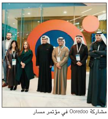
مشاركة Ooredoo في مؤتمر مسار

في مبادرة وطنية تعبر عن تقدير عميق لجهود رجال الصفوف الأمامية في الجهات الأمنية والعسكرية، الذين يواصلون أداء مهامهم بكل تفان لحماية الوطن وصون أمنه في ظل الظروف الراهنة، أعلنت Ooredoo الكويت عن إطلاق مبادرة تقديرية ضمن