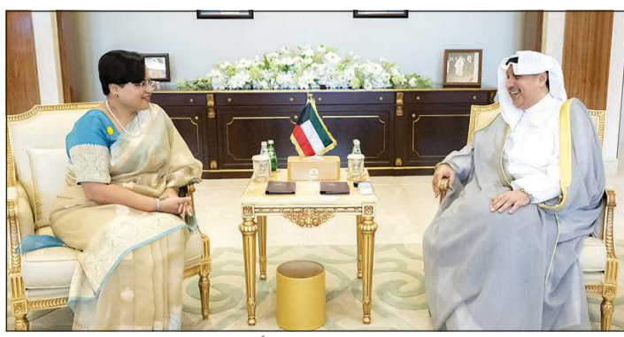
وزير شؤون الديوان الأميري الشيخ حمد جابر العلي مستقبلاً السفيرة الهندية باراميتا تريباتي

كما تلقى وزير الخارجية الشيخ جراح الجابر اتصالاً هاتفياً من وزير الخارجية والتعاون الدولي والمصريين بالخارج في جمهورية مصر العربية الشقيقة، دبدر عبدالعاطي، حيث تم خلال الاتصال مناقشة تطورات الأحداث الراهنة في المنطقة والجهود المبذولة بشأنها، وسبل تعزيز الأمن والاستقرار الإقليميين والدوليين.