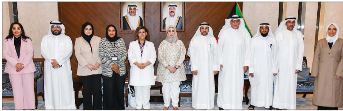
مساعد وزير الخارجية لشؤون حقوق الإنسان السفيرة الشريفة جواهر الدعيج ومساعد وزير الخارجية للقوى العاملة م.رباب العصيمي مع المشاركين في الاجتماع

أوضحت العصيمي أن الاجتماع تناول عددا من الملفات الاستراتيجية من بينها مقترحات تطوير التشريعات ذات العلاقة بحقوق أصحاب العمل والعمال إلى جانب التنسيق بشأن الملاحظات الدولية وتطبيقاتها في الكويت فضلاً عن تعزيز التعاون الثنائي مع الدول المرسلة للعمالة ومناقشة عقود العمل وآليات تنظيمها وسبل الحد من التحديات المرتبطة بها بما في ذلك مكافحة الاتجار بالأشخاص. وأضافت أن الاجتماع بحث كذلك سبل فتح مجالات جديدة لإستقدام العمالة المنزلية في إطار الجهود الرامية إلى تنظيم سوق العمل وتعزيز تنوع