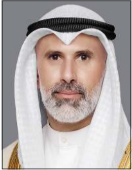
الشيخ جراح الجابر

كما تلقى وزير الخارجية الشيخ جراح الجابر اتصالاً هاتفياً من وزير الخارجية والتعاون الدولي والمصريين بالخارج في جمهورية مصر العربية الشقيقة، دبدر عبدالعاطي، حيث تم خلال الاتصال مناقشة تطورات الأحداث الراهنة في المنطقة والجهود المبذولة بشأنها، وسبل تعزيز الأمن والاستقرار الإقليميين والدوليين.