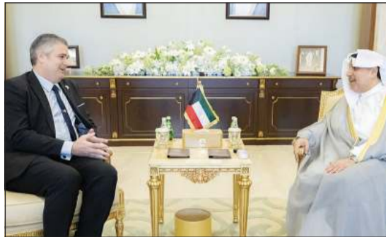
وزير شؤون الديوان الأميري الشيخ حمد جابر العلي خلال استقباله السفير الكوبي آلان بيريز توريس

ملحوظ على مختلف الأصعدة، لاسيما في المجالات التنموية والاقتصادية والمشاريع الحيوية، إلى جانب بحث سبل توسيع آفاق التعاون بما يواكب تطلعات البلدين الصديقين ويدعم مسار الشراكة القائمة بينهما. واستقبل الشيخ حمد جابر العلي السفيرة باراميتا تريباتي سفيرة جمهورية الهند الصديقة لدى دولة الكويت، وشهد اللقاء استعراض الروابط التاريخية والعلاقات الثنائية المتميزة التي تجمع دولة الكويت وجمهورية الهند الصديقة وما تشهده من تطور ونماء في مختلف المجالات، إضافة إلى بحث سبل تعزيز أطر التعاون بما يعكس حرص البلدين الصديقين على الارتقاء بها إلى آفاق أرحب.