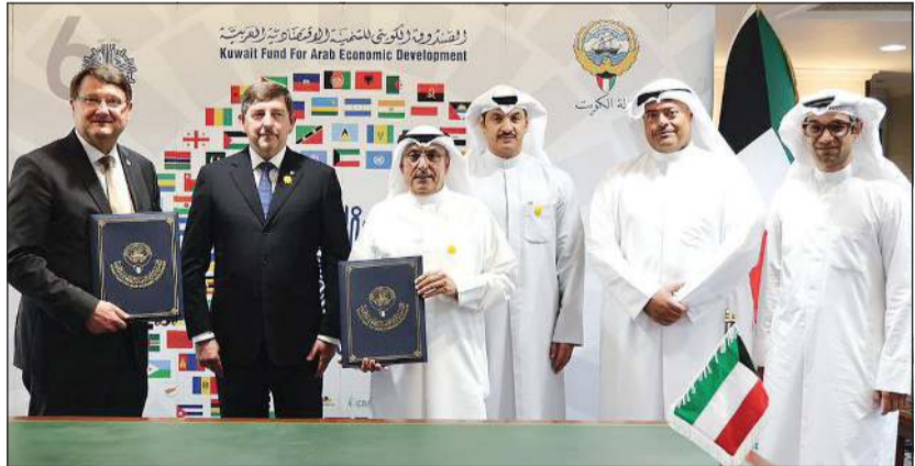
وليد البحر والسفير توماس لورينغيتش عقب توقيع مذكرة التفاهم

بعد مشاورات دورية لتنسيق العمليات والأنشطة الميدانية في البلدان الشريكة بما يراعي الأولويات والتوجهات الخاصة بكل منهما. كما تشمل مجالات التعاون على تحديد وتقييم المشاريع والبرامج التي تستوفي شروط الدعم من كلا الطرفين، بالإضافة إلى تبادل المنشورات والدراسات الفنية ذات الطابع العام، والمشاركة المتبادلة في الندوات وورش العمل المتخصصة حول القضايا ذات الاهتمام المشترك، وصولاً إلى القيام بأي أنشطة إضافية يتفق عليها الجانبان مستقبلاً بما يخدم الأهداف التنموية والإنسانية. ونأتي هذه الخطوة لتعكس التزام الصدوق الكويتي للتنمية ببناء شراكات دولية فاعلة تسهم في رفع كفاءة العمل الإنساني، وتعزز من أثر المساعدات التي تقدمها دولة الكويت لدعم الاستقرار والتنمية في مختلف أنحاء العالم.