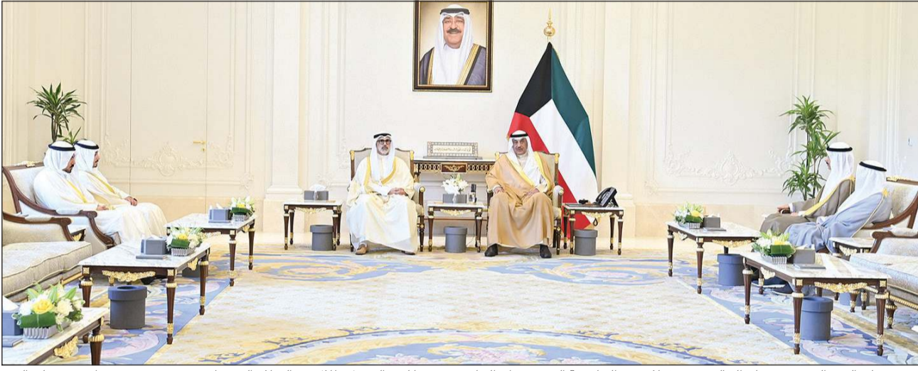
سمو ولي العهد الشيخ صباح خالد مستقبلاً وزير الخارجية الشيخ جراح الجابر وسفيرنا لدى التشيك طلال عبدالسلام الشطي بحضور رئيس ديوان سمو ولي العهد الشيخ ثامر الجابر ومساعد وزير الخارجية لشؤون المراسم الوزير المفوض عبدالمحسن الزيد