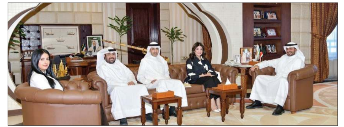
محافظ مبارك الكبير ومحافظ حولي بالتكليف الشيخ صباح بدر السالم خلال استقباله مدير عام بلدية الكويت م.منال العصفور بحضور مدير فرع بلدية محافظة مبارك الكبير م.حمود المطيري ورئيس عمليات البلدية يوسف الفجي