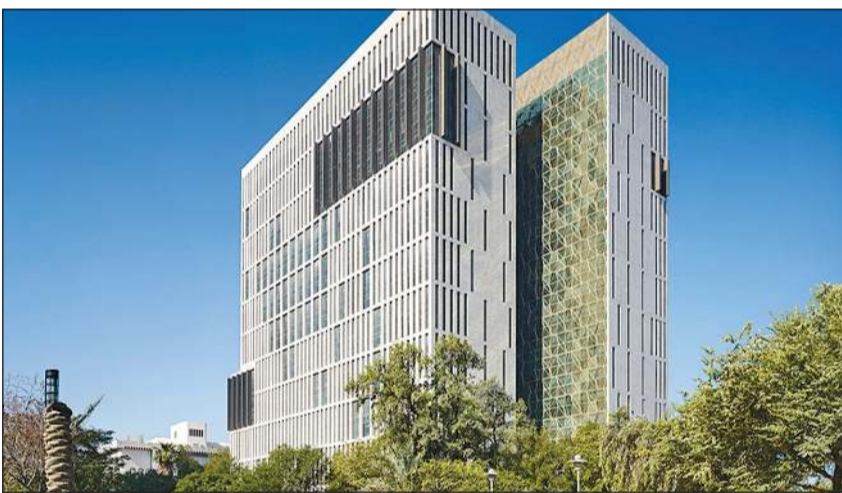
وأوضحت المصادر التزام المجلس الأعلى للقضاء بتنفيذ سياسة التكويت في جميع الأجهزة القضائية التي أمر بها صاحب السمو الأمير الشيخ مشعل الأحمد.

أسماء ابوالسعود علمت «الأنباء» من مصادر قضائية رفيعة ان محاكم التميز والإستئناف والكلية ستعقد جمعياتها العامة قبل عيد الأضحي المبارك إيداناً بانتهاء الموسم القضائي 2026 وبداية العطلة القضائية الصيفية. وتتضمن كل جمعية عامة كلمة لرئيس المحكمة يستعرض خلالها ما تم إنجازه خلال الموسم القضائي وخطة العمل الصيفية وتوزيع الدوائر، كما يتم تدوير بعض القضاة الذين انتهت مدة عملهم في مختلف الدوائر.