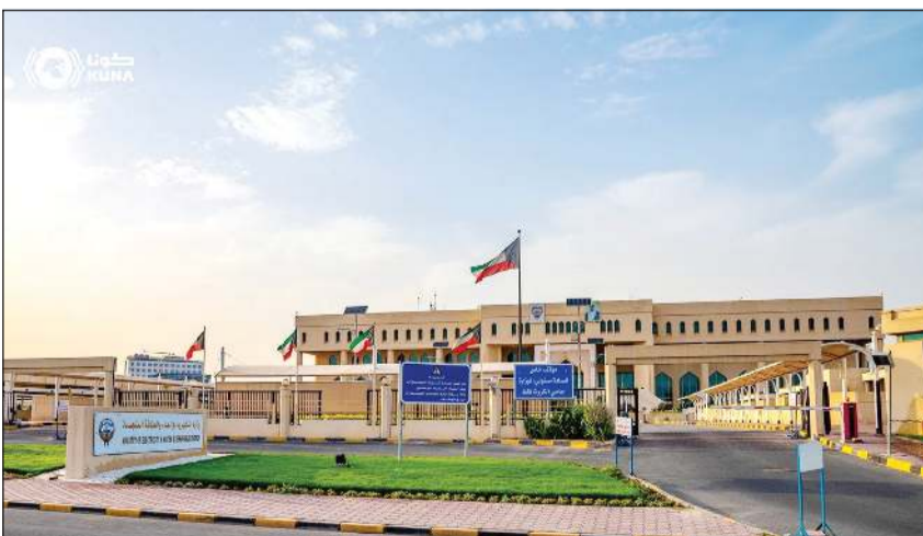
مبنى وزارة الكهرباء والماء والطاقة المتجددة

الوزارة مستمرة في إيصال التيار لأهالي المدينة تزامناً مع تشغيل المحطات الثانوية التي تغذي تلك القسائم بالتنسيق مع المؤسسة العامة للرعاية السكنية