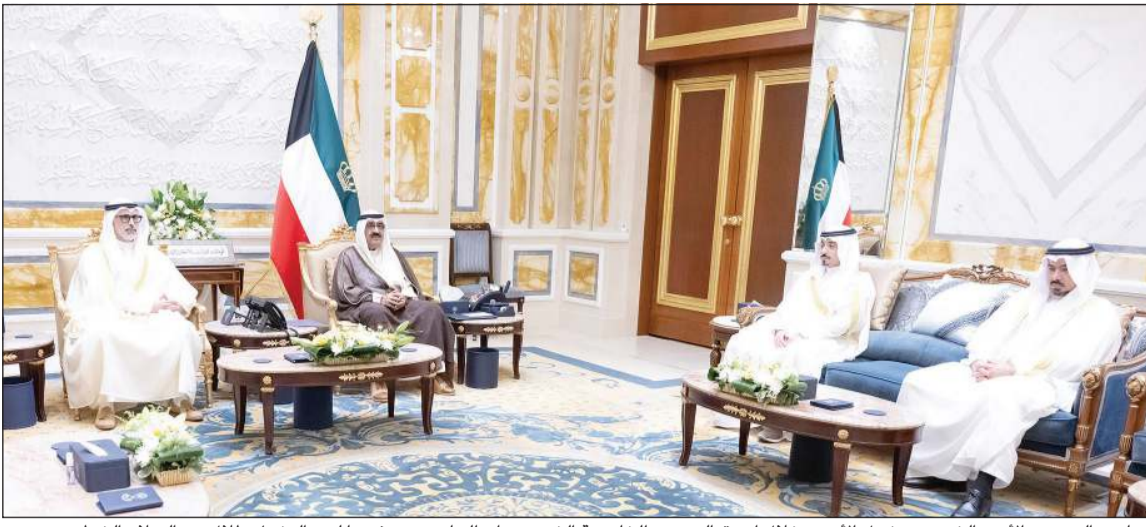
صاحب السمو الأمير الشيخ مشعل الأحمد خلال استقباله وزير الخارجية الشيخ جراح الجابر وسفيرنا لدى التشيك طلال عبدالسلام الشطي بحضور مساعد وزير الخارجية لشؤون المراسم الوزير المفوض عبدالمحسن الزيد