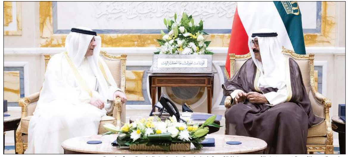
صاحب السمو الأمير الشيخ مشعل الأحمد مستقبلاً الأمين العام لمجلس التعاون لدول الخليج العربية جاسم البديوي

ولي العهد التقى الأمين العام لمجلس التعاون لدول الخليج العربية ووزير الخارجية وسفيرنا لدى التشيك