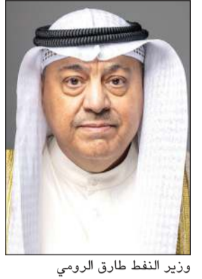
وزير النفط طارق الرومي

وفق روح المسؤولية الجماعية والحوار البناء والتنسيق بهدف توازن السوق النفطية. جاء ذلك في تصريح للوزير الرومي نقله بيان صادر عن (النفط)، عقب ترؤسه وفد