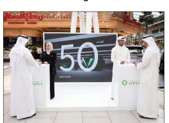
جناح بيت التمويل الكويتي المشارك في المعرض

العلاقات والتعاون والتنسيق المشترك وتنشيط الأعمال مع الموردين والتجار، كما تسهم المشاركة كذلك في توفير الفرصة أمام العملاء للحصول على مزايا عدة تحقق طموحاتهم وتلبي احتياجاتهم التمويلية، في إطار مساعي بيت التمويل الكويتي لتقديم أفضل الخدمات التمويلية لعملائه، بما يحفظ قاعدة العملاء الواسعة، ويستقطب عملاء جدد، وزيادة الحصة السوقية، وإبراز دوره كمساهم في دفع عجلة الاقتصاد، وقد أثنى زوار المعرض ورواده من عملاء بيت التمويل الكويتي على مستوى الخدمة وحجم ونوعية الحلول التمويلية التي يقدمها البنك بما يتناسب مع ظروف وإمكانيات