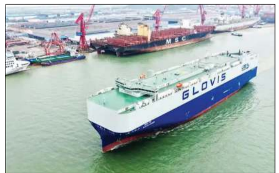
السفينة «غلويس ليدر»

بكين - كونا: أعلنت الصين تسليم أكبر سفينة لنقل السيارات في العالم تبلغ قدرتها الاستيعابية القصوى 10800 مركبة إلى شركة كورية جنوبية في مدينة كوانزو جنوبي البلاد. وذكرت وكالة أنباء الصين الجديدة (شينخوا) أن السفينة «غلويس ليدر»، التي بنتها شركة صناعة السفن الصينية المحدودة (سي إس إس سي) لصالح شركة الشحن الكورية الجنوبية «إتش إم إم» قدمت حلاً صينياً لدعم التحول الأخضر منخفض الكربون في قطاع الشحن البحري العالمي. وأشارت الوكالة إلى أن طول السفينة يبلغ 230 متراً وعرضها 40 متراً وغاطسها 10,5 أمتار، فيما تصل سرعتها التصميمية إلى 19 عقدة بحرية (نحو 35 كيلومتراً في الساعة). وأضاف «شينخوا» أن الناقله المكونة من 14 طباقاً تتميز بنظام دفع ثنائي عامل بالغاز الطبيعي المسال والوقود التقليدي بما يلي معايير الانبعاثات من المستوى الثالث للمنظمة البحرية الدولية.