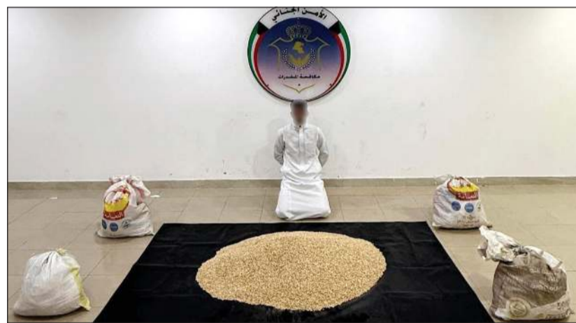
المتهم الخليجي وامامه المضبوطات

ضبط مرسل الشحنة من قبل مكتب مكافحة المخدرات اللبناني ■ المواد المخدرة أخفيت في شحنة مواد غذائية بطريقة مبتكرة