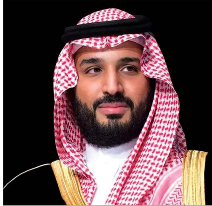
صاحب السمو الملكي الأمير محمد بن سلمان ولي العهد رئيس مجلس الوزراء رئيس مجلس الشؤون الاقتصادية والتنمية السعودي

واس: أكد صاحب السمو الملكي الأمير محمد بن سلمان ولي العهد رئيس مجلس الوزراء رئيس مجلس الشؤون الاقتصادية والتنمية السعودي، أن رؤية «المملكة 2030» قد أحدثت - بتوفيق الله وفضله - ثم بتوجيهات خادم الحرمين الشريفين الملك سلمان بن عبدالعزيز آل سعود، نقلة نوعية في مسيرة تنمية البلاد، بما حققته من تحول شامل وملاموس في المناحي الاقتصادية والخدمات والبنية التحتية واللوجستية، وجوانب الحياة الاجتماعية، واستهلكت في عام (2026) مرحلتها الثالثة والأخيرة التي تمتد لخمس سنوات قادمة حتى عام (2030)، محافظة فيها على التركيز على أهدافها طويلة المدى مع تكيف أساليب التنفيذ وفق متطلبات المرحلة، بما يدفع استدامة التقدم والأزدهار ويجعل المملكة في طليعة الدول تقدماً.