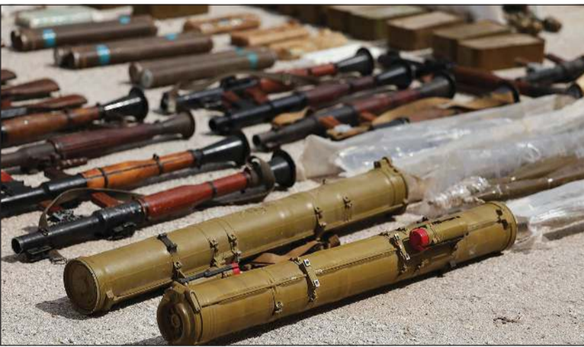
بعض الأسلحة التي ضبطتها وزارة الداخلية السورية

وكالات: أفادت وزارة الداخلية بأن قوى الأمن الداخلي نجحت «بالتعاون مع جهاز الاستخبارات العامة، في تفكيك خلية إرهابية ضمن محافظة حمص، وإحباط مخطط تخريبي كانت تعتزم تنفيذه لاستهداف الأمن والاستقرار في المنطقة».