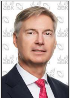
جيل جان فان دير تول