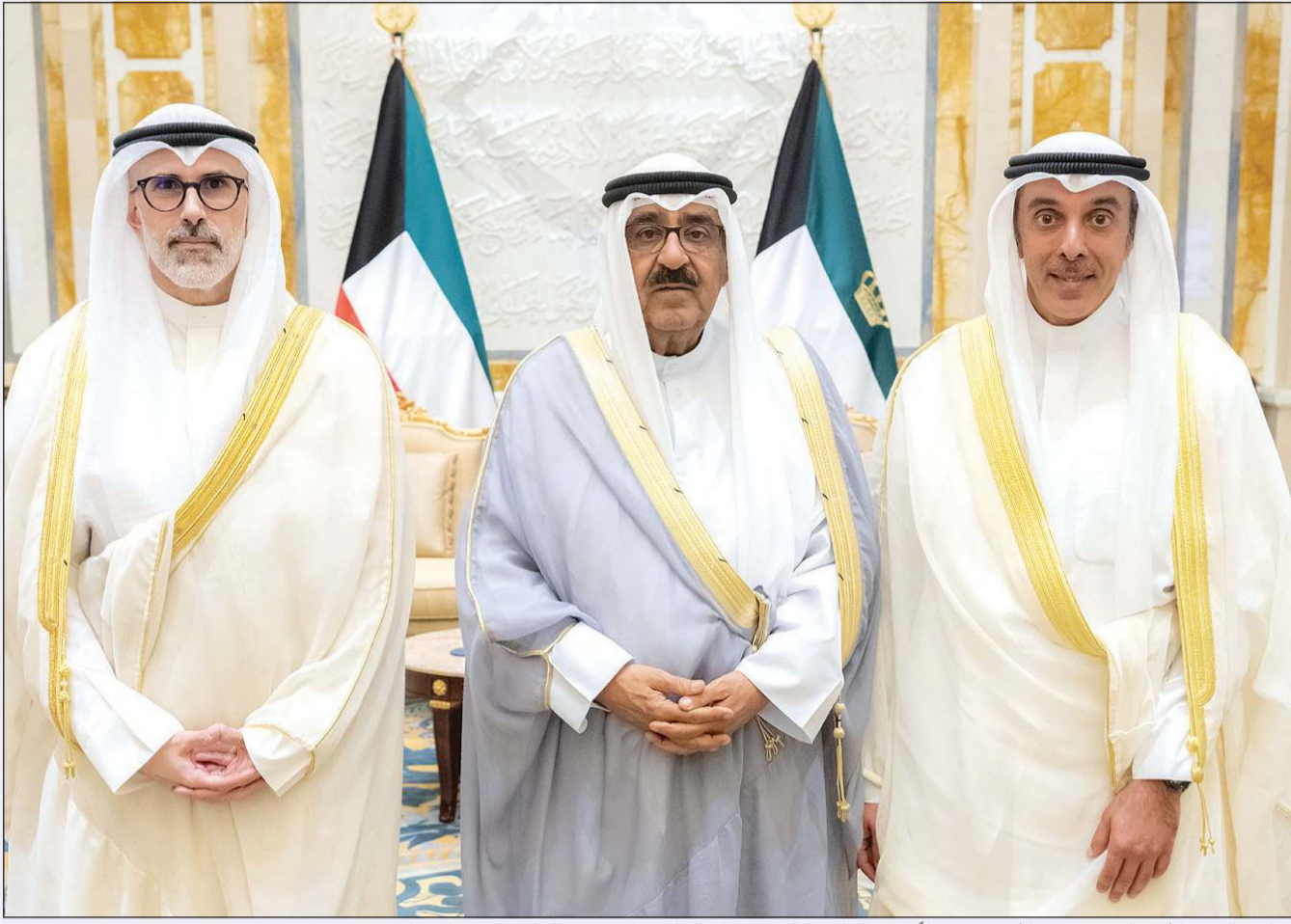
صاحب السمو الأمير الشيخ مشعل الأحمد مستقبلاً وزير الخارجية الشيخ جراح الجابر ونائب وزير الخارجية حمد المشعان

الأمير وولي العهد ورئيس الوزراء استقبلوا وزير الخارجية ونائبه بمناسبة تعيينه في منصبه الجديد