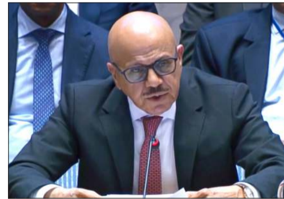
وزير خارجية البحرين عبداللطيف الزياني مقرئاً جلسة مجلس الأمن الدولي

أعلن ديوان الخدمة المدنية عن ترشيح عدد من المسجلين في نظام التوظيف المركزي غذا الأربعاء استكمالاً للمرحلة الثانية من خطة الاحتياجات الوظيفية للجهات الحكومية، وأوضح أن الدفعة ستشمل المسجلين الذين لم يستكملوا إجراءات الترشيح لدى الجهات المعنية تليهم فئة المؤهلين للترشيح لأول مرة، مشيراً إلى أن فتح باب التسجيل في نظام التوظيف المركزي للفترة 94 اعتباراً من يوم الجمعة المقبل الأول من مايو، من جانبه، صرح