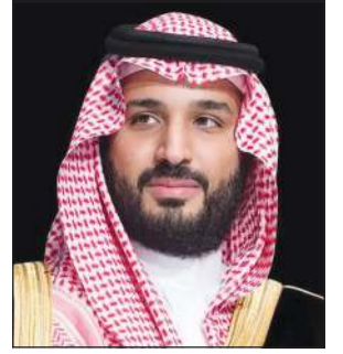
صاحب السمو الملكي الأمير محمد بن سلمان ولي العهد رئيس مجلس الوزراء رئيس مجلس الشؤون الاقتصادية والتنمية السعودي

مجلس الشؤون الاقتصادية والتنمية السعودي استعرض منجزات «رؤية المملكة 2030».. بالتزامن مع دخولها المرحلة الثالثة والأخيرة لمدة 5 سنوات قادمة حتى 2030 محمد بن سلمان: «رؤية السعودية 2030» أحدثت نقلة نوعية بمسيرة تنمية المملكة