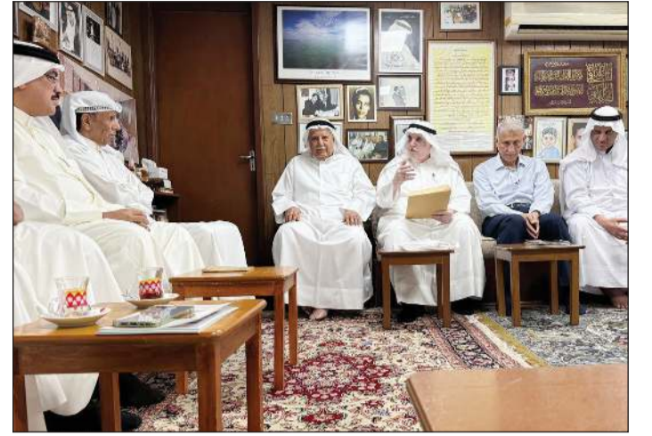
جانب من رواد الديوانية