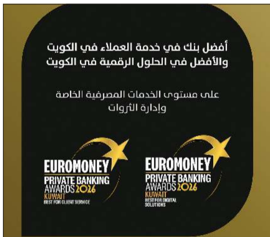
جوائز بوبيان من «يورومني» في الخدمات المصرفية الخاصة

للمعامل الوصول إلى خدماتهم الاستثمارية وإدارة محافظهم المالية بسهولة، مع الحفاظ على استيعاب صفقات كبيرة الحجم الطرح إلى رأس المال، مع تحقيق متحولات بلغت 195 مليون دولار، ليصبح أكبر طرح في المنطقة خلال الفترة، كما أن تنفيذ الصفقة عبر طرح خاص يعكس مرونة هيكل السوق في الكويت وقدرته على استيعاب صفقات كبيرة خارج الأطر التقليدية للاكتتاب العامة. وفي مصر، شكل إدراج «جورميه مصر» خطوة لافتة كاول شركة تجزئة للأغذية والمشروبات تدخل البورصة، ما يعزز تنوع القطاعات المدرجة ويوسع قاعدة السوق.