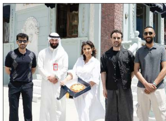
صورة جماعية لفريق بنك الخليج خلال الفعاليات

وقدرتها على التكيف مع الظروف المناخية القاسية، ما يجعلها رمزاً للصمود والجمال الطبيعي في البيئة الكويتية. وقد لاقت فعاليات «نقصة الخليج» تفاعلاً واسعاً من قبل العملاء، الذين أعربوا عن شكرهم وتقديرهم لبنك الخليج على هذه المبادرة المميزة، مشيدين بدوره في دعم المشاريع الكويتية وتعزيز روح المشاركة المجتمعية، كما عبروا عن امتنانهم وتقديرهم الكبيرين لثقتهم بمنتجات وخدمات بنك الخليج، الذين قدموا التضييق وواجهوا تحديات كبيرة خلال الفترة الماضية. وتعد «زهرة العرفج» من النباتات البرية الشهيرة في دولة الكويت، وهي الزهرة الوطنية للبلاد، حيث تنمو في البيئة الصحراوية، وتتميز بلونها الأصفر الزاهي