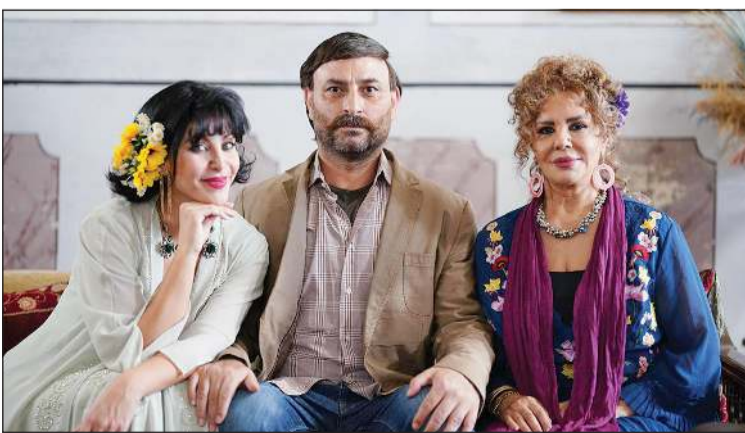
مشهد من مسلسل «ما اختلفنا»

وقد ضمت الأجزاء السابقة نخبة من نجوم الدراما السورية، من بينهم: سامية الجزائري، منى واصف، باسم ياخور، نادين تحسين بيك، عبدالمنعم عمايري، إلى جانب عدد كبير من الأسماء التي أسهمت في إثراء العمل وتنوعه. ويحافظ «ما اختلفنا» على أسلوبه القائم على اللوحات الكوميدية المنفصلة، التي يكتبها أكثر من مؤلف، مقدماً مزيجاً معاصراً، مع الحفاظ على الروح التي أجبها الجمهور منذ انطلاقته.