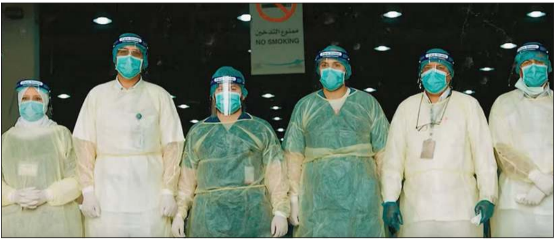
مشهد من كليب الأغنية