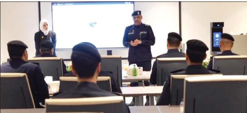
وكيل وزارة الداخلية اللواء عبدالوهاب الوهيب خلال الزيارة

وأعرب عن تقديره للجهود المبذولة من قبل العاملين في الإدارة، مشيدا بكفاءتهم وحرصهم على مواكبة أحدث المستجدات التقنية، مؤكدا أهمية «استمرار العمل بروح الفريق الواحد لتحقيق المزيد من التطوير والإنجاز بما يعكس الصورة المؤسسية المتقدمة لوزارة الداخلية». ووفق البيان، استمع اللواء الوهيب خلال الجولة إلى شرح مفصل حول أبرز الأنظمة الإلكترونية المعتمدة والبيانات تطوير البنية التحتية الرقمية وكذلك المشاريع التقنية الحالية والمستقبلية الهادفة إلى دعم المنظومة الأمنية وتسريع الإجراءات ورفع كفاءة الأداء المؤسسي.