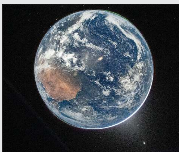
من الصور التي تم التقاطها للأرض خلال مهمة «أرتيميس 2»

«ناسا» تكشف عن صور جديدة للأرض التقطها رواد مهمة «أرتيميس 2» التاريخية