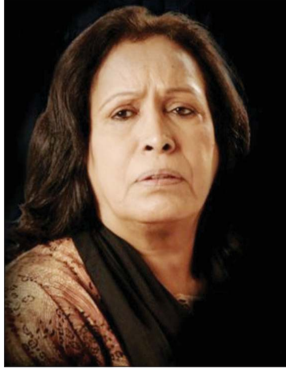
الفنانة القديرة الراحلة حياة الفهد