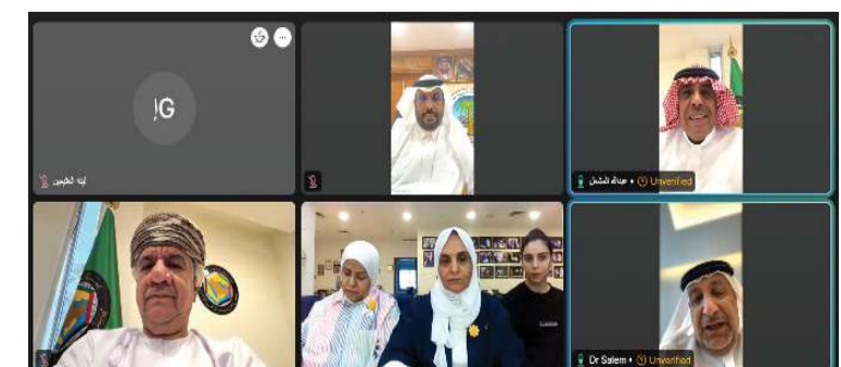
رؤساء الجمعيات الكشفية بدول مجلس التعاون الخليجي خلال الاجتماع الافتراضي

عقد رؤساء الجمعيات الكشفية بدول مجلس التعاون الخليجي اجتماعاً افتراضياً بمشاركة أمناء الجمعيات تمت خلاله مناقشة الخطة التشغيلية المنبثقة من الإستراتيجية الموحدة للكشافة والمرشدات في دول المجلس (2026 - 2030).