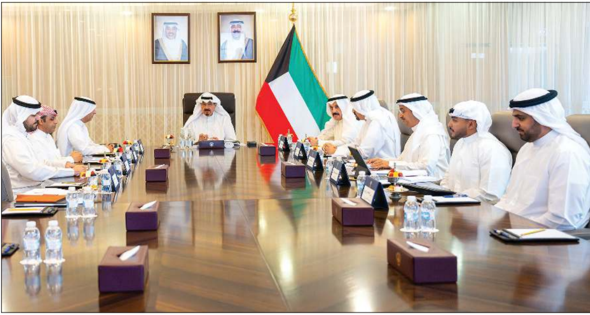
رئيس الوزراء سمو الشيخ أحمد العبدالله مترئسا اجتماع اللجنة الوزارية رقم (49) لمتابعة تنفيذ المشاريع التنموية الكبرى بحضور وزير الدفاع الشيخ عبدالله العلي ووزير الدولة لشؤون البلدية ووزير الدولة لشؤون الإسكان عبداللطيف المشاري ووزير الدولة للشؤون الاقتصادية والاستثمار عبدالعزيز ناصر المرزوق والمستشار بديوان رئيس مجلس الوزراء بالإتابة الشيخ خالد محمد الخالد ووزيرة الأشغال العامة د. نورة المشعان ووزير الكهرباء والماء والطاقة المتجددة د. صباح المخيزيم ووزير المالية د. يعقوب الرفاعي ومدير عام هيئة تشجيع الاستثمار المباشر الشيخ د. مشعل الجابر ورئيس إدارة الفتوى والتشريع المستشار صلاح الماجد