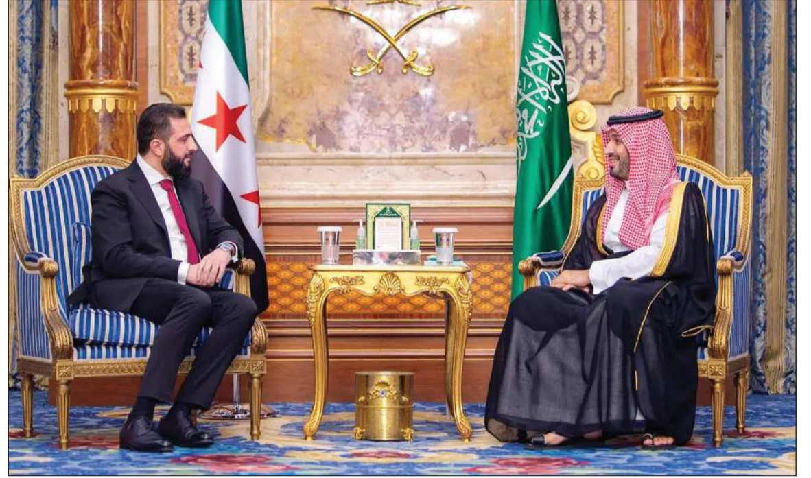
صاحب السمو الملكي الأمير محمد بن سلمان بن عبدالعزيز ولي العهد رئيس مجلس الوزراء السعودي مستقبلاً الرئيس السوري أحمد الشرع

شهباز شريف، ورئيس المجلس الأوروبي أنطونيو كوستا. وأوضح وزير الإعلام سلمان بن يوسف الدوسري، في بيانه للوكالة السعودية عقب الجلسة، أن مجلس الوزراء تناول إثر ذلك نتائج مشاركات المملكة في الاجتماعات الدولية ضمن دعمها المتواصل للعمل متعدد الأطراف الذي يعزز التشاور والتنسيق تجاه التطورات والتحديات في المنطقة والعالم، بما يسهم في مساندة الجهود الرامية إلى ترسيخ الحوار والحلول الدبلوماسية وتحقيق الأمن والسلام إقليمياً ودولياً. وتابع المجلس تطورات حركة الملاحة البحرية في «مضيق هرمز»، مؤكداً ضمن هذا السياق أن استثمارات المملكة الممتدة لشركاء الصرافة المرخصة، مشيراً إلى البديلة، عززت قدراتها في دعم العالم بالأحداث والتوترات الجيوسياسية بالمنطقة وتداعياتها على سلاسل الإمداد العالمية.