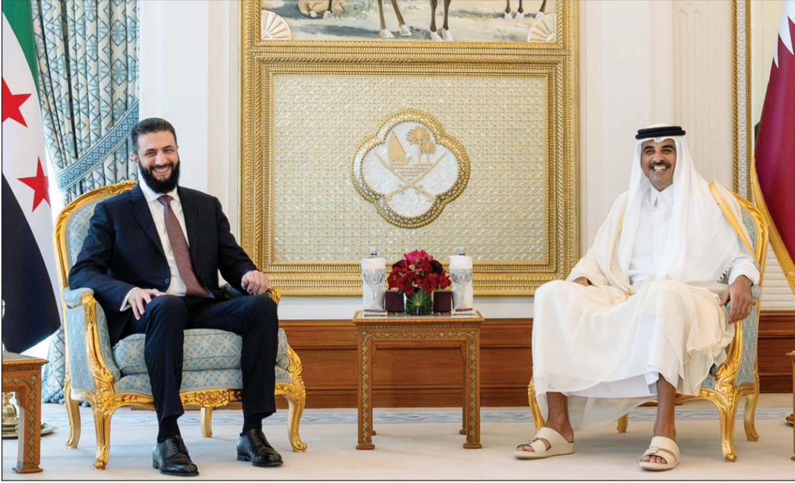
صاحب السمو الشيخ تميم بن حمد آل ثاني أمير دولة قطر مستقبلاً الرئيس السوري أحمد الشرع في الدوحة أمس