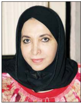
الشبيخة دسعاد الصباح

الصباح على إطلاقها جائزة الطفل الغزي المبدع وعلى رعايتها حفل توزيع الجوائز، مشيرة إلى أن الله تعالى جعلها سبباً من أسباب السور لقلب كل طفل حضر هذا الحفل.