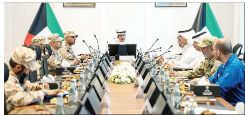
وكيل وزارة الأشغال بالتكليف عيد الرشيدفي خلال الاجتماع مع فريق «أمان»

بما يسهم في رفع مستوى الجاهزية الوطنية وتعزيز القدرة على مواجهة التحديات. وعقد الاجتماع بحضور ممثلي وزارة الأشغال العامة برئاسة الوكيل بالتكليف عيد الرشيد في الجانب عدد من مسؤولي الوزارة وأعضاء فريق «أمان»