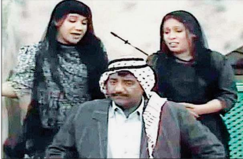
الرحلة حياة الفهد في مشهد من «رقية وسيبكية»