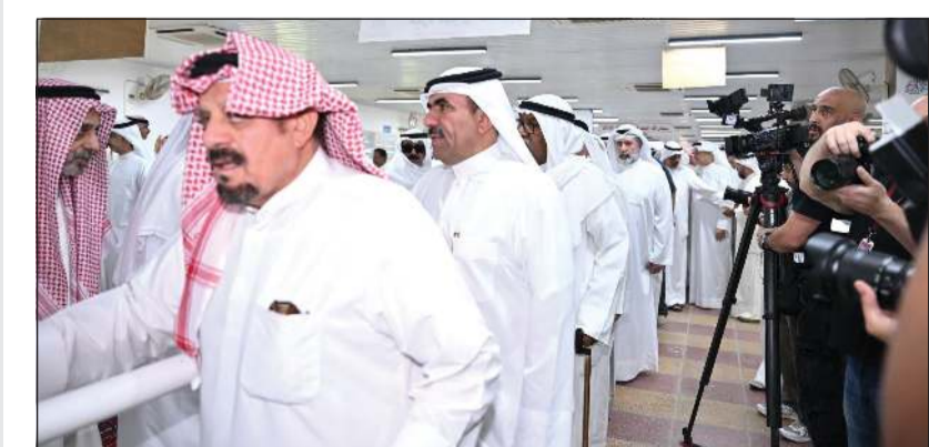
جانب من جموع المعزين

الحضور على مختلف مجالاته وقفوا صفاً واحداً، لا لتوديع ممثلة فحسب، بل لوداع مرحلة كاملة من الدراما الخليجية ارتبطت بصوتها وملامحها وأدوارها التي