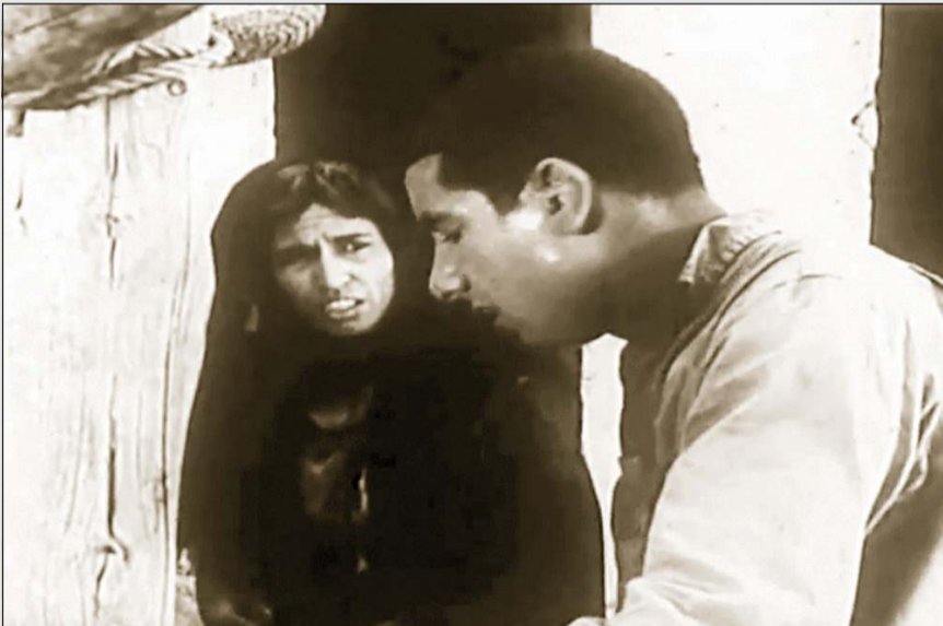
الرحلة حياة الفهد مع الفنان محمد المنصور في فيلم «يس يا بحر»